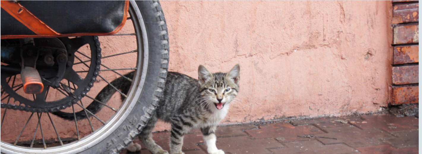
Eine Übersicht, wo die in Birmensdorf ansässige Stiftung überall tätig ist, finden Sie unter www.tierbotschafter.ch

Man kann es nicht genug betonen: Wegsperrern, vermitteln, deportieren und töten der Tiere löst Streuner-Probleme nicht! Was hilft, ist TNR. TNR heisst TRAP-NEUTER-RETURN und bedeutet die systematische Kastration von Hunden und Katzen und das anschliessende Zurückbringen ins angestammte Revier. Es ist die einzige nachhaltige, finanzierbare und erfolgsversprechende Lösung der Streunerproblematik in vielen Ländern.