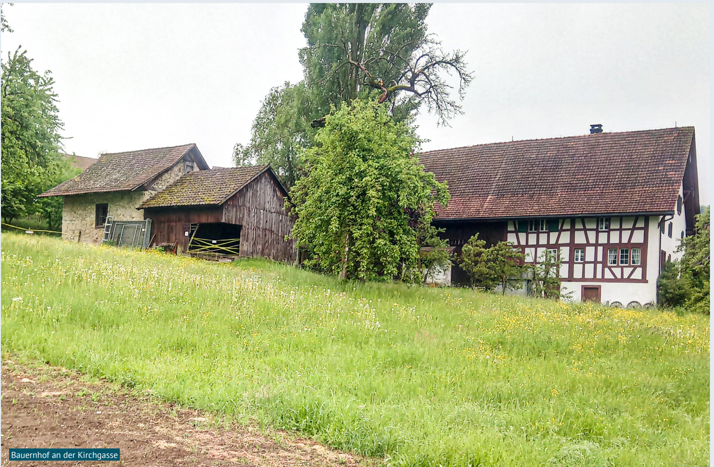
Bauernhof an der Kirchgasse