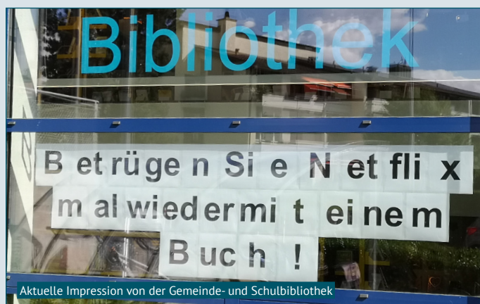
Aktuelle Impression von der Gemeinde- und Schulbibliothek

Die Beisetzung hat bereits stattgefunden.