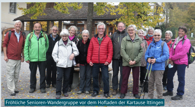
Fröhliche Senioren-Wandergruppe vor dem Hofladen der Kartause Ittingen

Dank einer guten Zusammenarbeit von Staat, Wirtschaft und Bevölkerung besteht die eindruckliche Klosteranlage immer noch und ist heute ein lebendiges Kultur- und Tagungszentrum. Es beherbergt ein Hotel und das Restaurant Mühle, einen Gutsbetrieb mit eigener Käserei und Weinbaubetrieb, ein Wohnheim und Werkstätten für Menschen mit Beeinträchtigung sowie das Kunstmuseum Thurgau und Ittinger Museum.