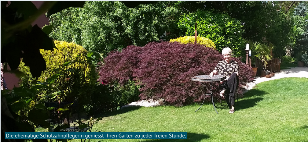
Die ehemalige Schulzahnpflegerin genießt ihren Garten zu jeder freien Stunde.