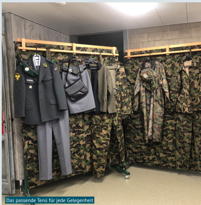
Das passende Tenü für jede Gelegenheit