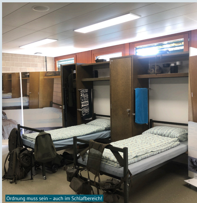
Ordnung muss sein – auch im Schlafbereich!

Am Orientierungstag zeigte man uns die verschiedenen Tarnanzüge der Schweizer Armee. «Ich wusste gar nicht, dass es verschiedene Kleidungen gibt für Ausgänge und Dienst», dachte ich mir. Und anstehen, das mussten wir bereits üben! Denn sie wollten von uns noch die Körpertemperatur messen, bevor wir in Gruppen aufgeteilt wurden. Nun kam das, was ich befürchtet hatte: es gab für alle eine kleine Sportvorbereitung. Heisst: Wie können wir uns auf den sportlichen Leistungstest vorbereiten, wie übt man das Rennen etc. Aber auch erste Regeln wurden uns beigebracht, wann man als Rekrut vom «Usgang» in der Kaserne