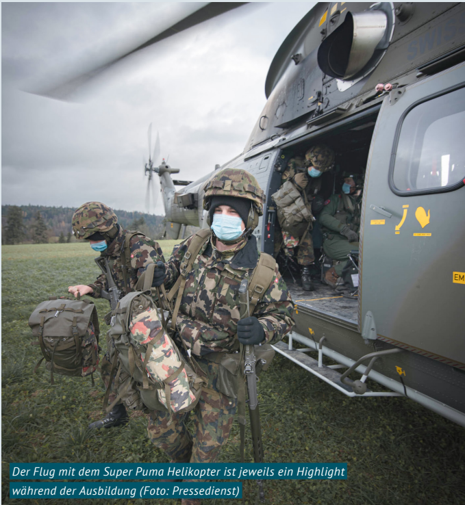
Der Flug mit dem Super Puma Helikopter ist jeweils ein Highlight während der Ausbildung