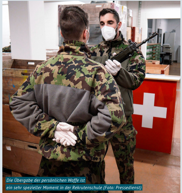
Die Übergabe der persönlichen Waffe ist ein sehr spezieller Moment in der Rekrutenschule

Die Infanterie Durchdiener in Birmensdorf absolvieren ihre gesamte Dienstzeit von 300 Diensttagen (zehn Monate) am Stück. Zum Ende ihrer Zeit an der Inf DD Schule 14 haben die Wehrmänner ihre obligatorische Dienstzeit erfüllt. Sie bleiben während sieben Jahren in der Reserve eingeteilt. Während der Ausbildung werden den Rekruten Werte wie Anstand, Ehrlichkeit und Respekt vermittelt. Ausserdem wird ein besonderes Augenmerk auf Disziplin, Ausdauer und Eigenverantwortung gelegt. Professionelles Auftreten, Selbstvertrauen, Stolz und sportliche Leistungsfähigkeit werden ebenfalls gefördert – alles Eigenschaften, die zu einer gesunden Persönlichkeitsbildung beitragen. Diese sind den Rekruten auch im militärischen und zivilen Umfeld von grossem Nutzen und be-