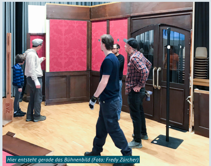
Hier entsteht gerade das Bühnenbild