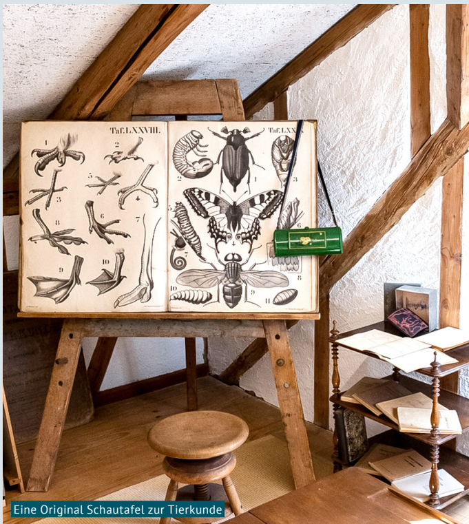
Eine Original Schautafel zur Tierkunde