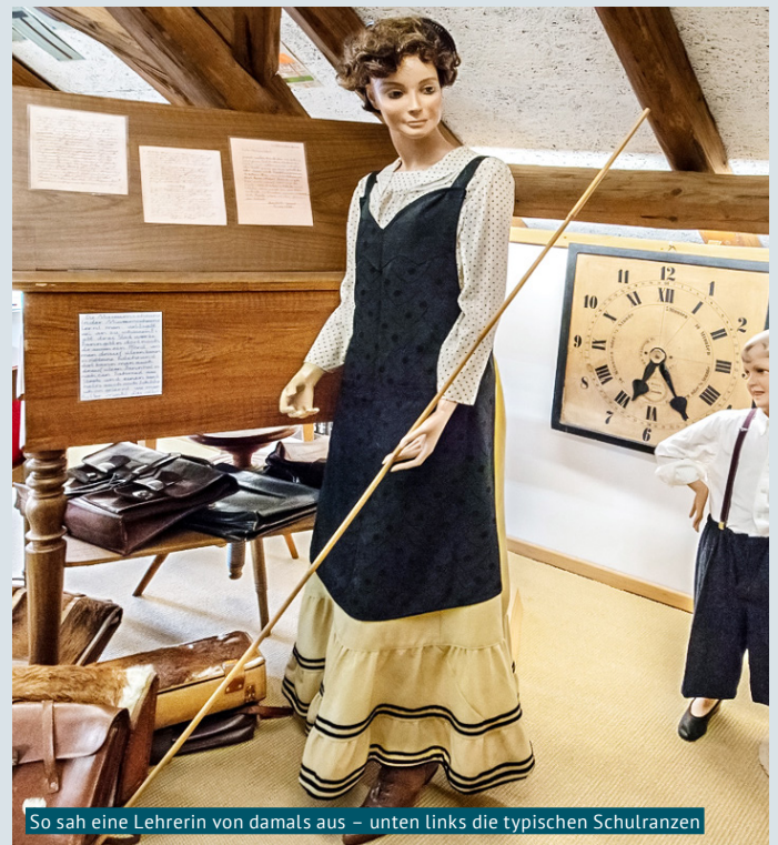
So sah eine Lehrerin von damals aus – unten links die typischen Schulanzen

An der Vernissage «Mit Kopf, Herz und Hand» konnte man einen Eindruck gewinnen über die Schule von damals und deren Entwicklung.