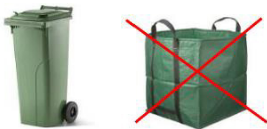
Kunststoffcontainer (grün) Grössen: 140L/240L/770L

Nur kompostierbare Rüst- und Gartenabfälle sowie Gartenabraum in genormten Containern mit Kippvorrichtung bis 7 Uhr bereitstellen.