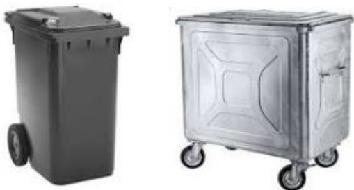
Kunststoffcontainer (schwarz/ Stahlcontainer (Verzinkt) grau)

Der Kehrichtsack (Gebührensack) wird erst am Abfuhrtag bis 7 Uhr (zugebunden) am Strassenrand bereitgestellt. Für die Zwischenlagerung am Strassenrand benützen Sie bitte die für den Kehrichtabfall aus Industrie, Gewerbe und Haushalt richtige Farbwahl der Container. Genormte Container gibt es in verschiedenen Grössen: 140, 240, 770 und 800 Liter Inhalt.