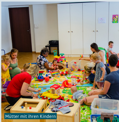
Mütter mit ihren Kindern