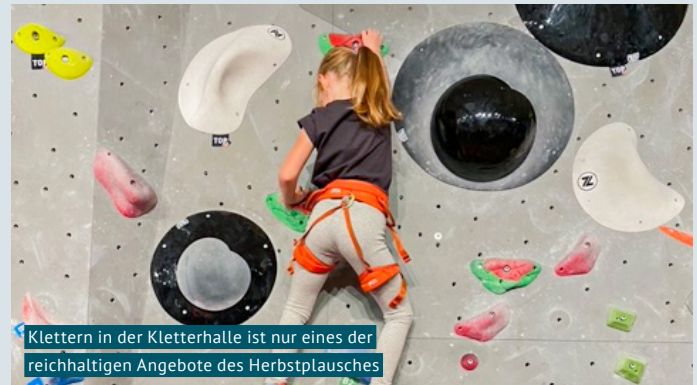
Klettern in der Kletterhalle ist nur eines der reichhaltigen Angebote des Herbstplausches

Die Geschichte des Elternforums führt zurück ins Jahr 2001, als sich eine Gruppe von Eltern für die Einführung von Blockzeiten und familienergänzender Kinderbetreuung einsetzte. Zur Vereinsgründung kam es schliesslich im Jahr 2007.