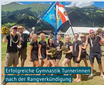
Erfolgreiche Gymnastik Turnerinnen nach der Rangverkündigung