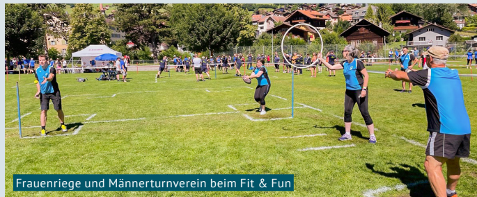
Frauenriege und Männerturnverein beim Fit & Fun