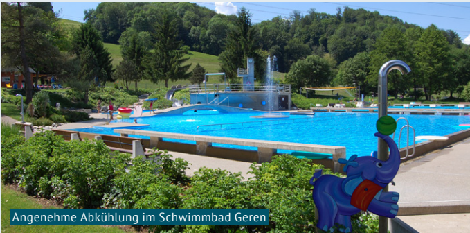
Angenehme Abkühlung im Schwimmbad Geren

Die Afrika-Hitzewelle ist nun definitiv auch in der Schweiz angekommen. Der Grund für die extreme Hitze ist ein sogenanntes Höhentief auf dem Atlantik vor der Iberischen Halbinsel. Dieses dreht sich gegen den Uhrzeigersinn und transportiert sehr heisse Luft aus Nordafrika nach Europa. Für die einen kann es nicht heiss genug sein, für andere hingegen wird die Hitze zur Qual.