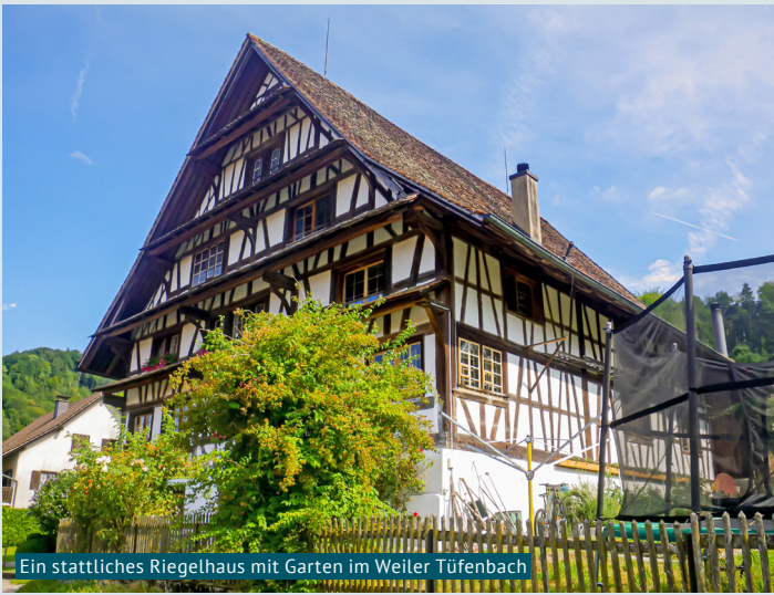
Ein stattliches Riegelhaus mit Garten im Weiler Tüfenbach