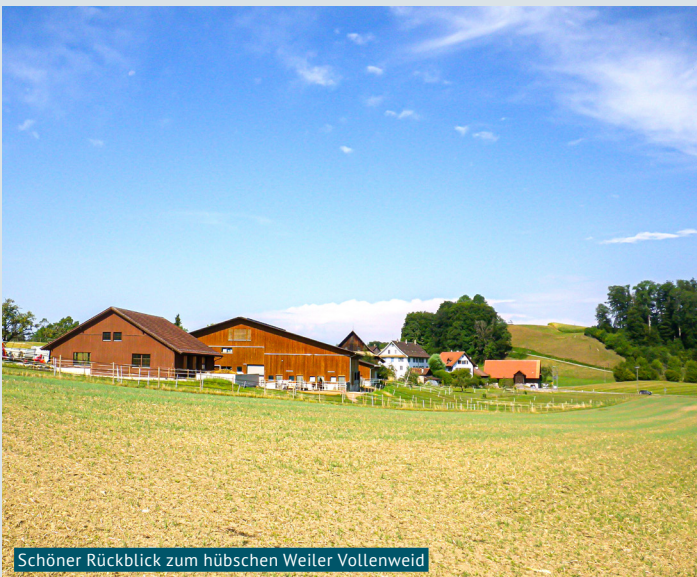
Schöner Rückblick zum hübschen Weiler Vollenweid