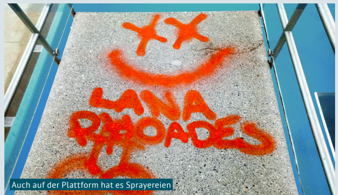
Auch auf der Plattform hat es Sprayereien