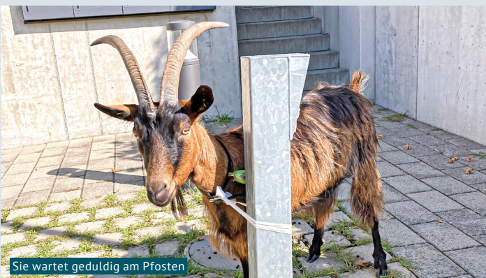
Sie wartet geduldig am Pfosten