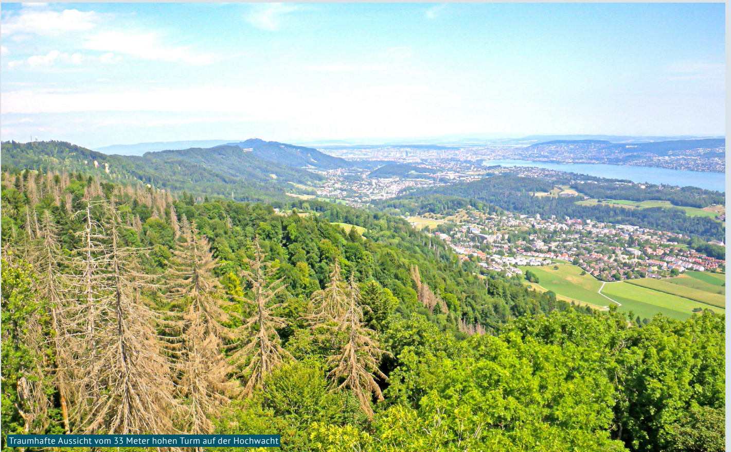
Traumhafte Aussicht vom 33 Meter hohen Turm auf der Hochwacht