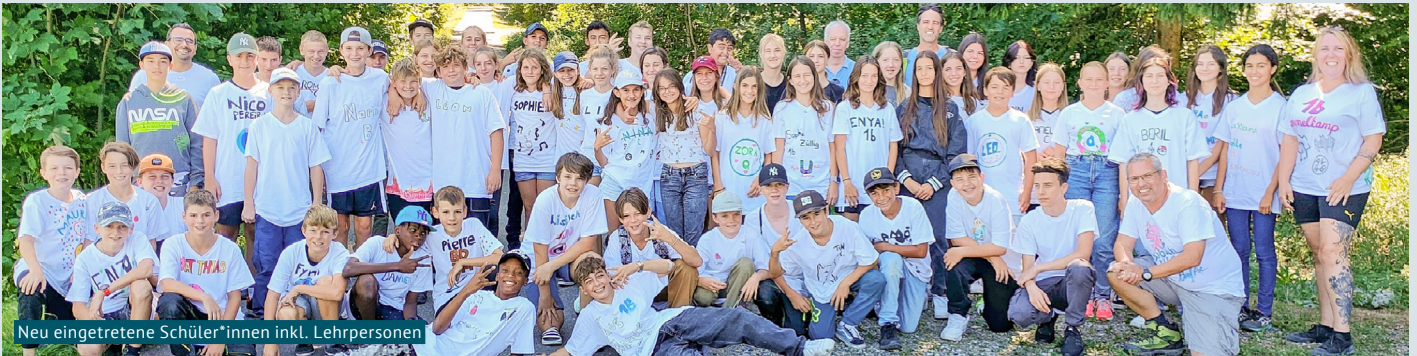
Neu eingetretene Schüler*innen inkl. Lehrpersonen

Nachdem am Morgen des 22. August im Gemeindezentrum Brüelmatt alle Jugendlichen der Sekundarschule Birmensdorf-Aesch durch die Schulleitung begrüsst worden waren, begann für die neu eingetretenen Sekundarschülerinnen und Sekundarschüler die «Einführungswoche».