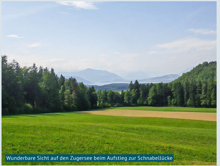
Wunderbare Sicht auf den Zugersee beim Aufstieg zur Schnabellücke