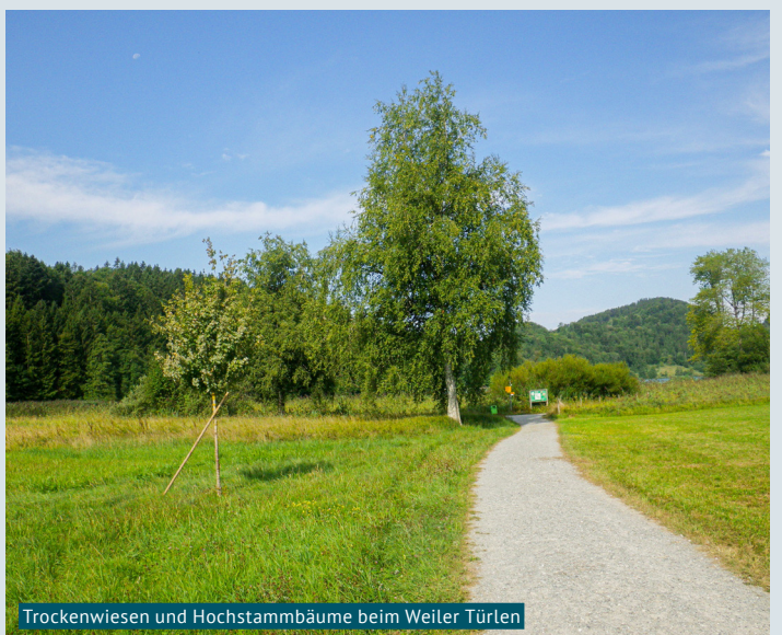
Trockenwiesen und Hochstamm-bäume beim Weiler Türlen