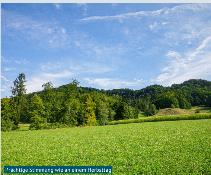
Prächtige Stimmung wie an einem Herbsttag