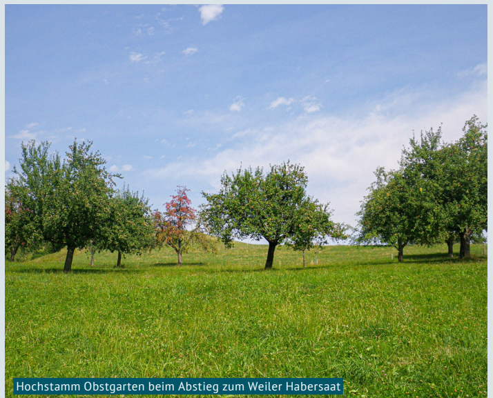
Hochstamm Obstgarten beim Abstieg zum Weiler Habersaat