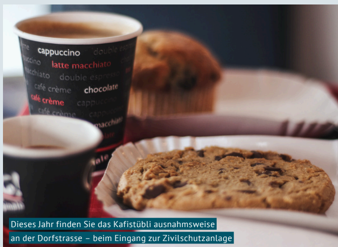
Dieses Jahr finden Sie das Kafistübli ausnahmsweise an der Dorfstrasse – beim Eingang zur Zivilschutzanlage