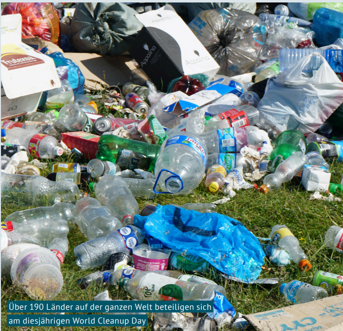
Über 190 Länder auf der ganzen Welt beteiligen sich am diesjährigen World Cleanup Day

IGSU – gegen Littering und für eine saubere Umwelt.