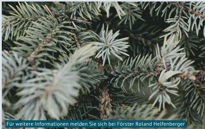
Für weitere Informationen melden Sie sich bei Förster Roland Helfenberger