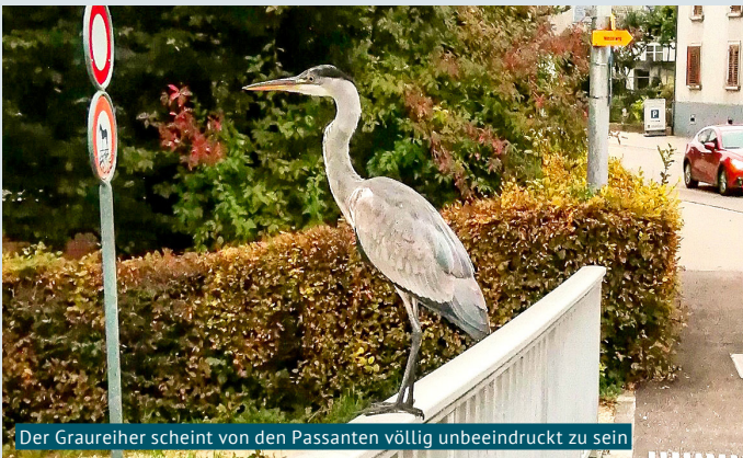
Der Graureiher scheint von den Passanten völlig unbeeindruckt zu sein

Am 30. September 2022 fotografierte ich einen Graureiher auf dem Geländer der Brücke über die Reppisch in Birmensdorf. Dieses Foto konnte gemacht werden, weil der Graureiher seine Scheu vor Menschen verloren hat.