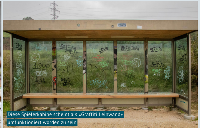
Diese Spielerkabine scheint als «Graffiti Leinwand» umfunktioniert worden zu sein