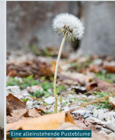
Eine alleinstandende Pustebblume