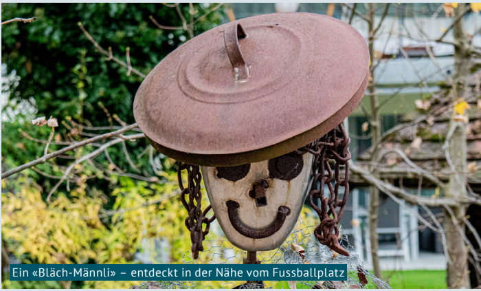
Ein «Bläch-Männli» – entdeckt in der Nähe vom Fussballplatz