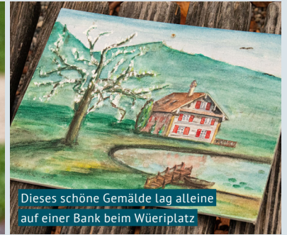
Dieses schöne Gemälde lag alleine auf einer Bank beim Wüeriplatz