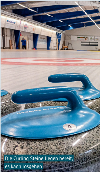
Die Curling Steine liegen bereit, es kann losgehen