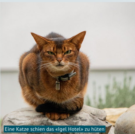
Eine Katze schien das «Igel Hotel» zu hüten