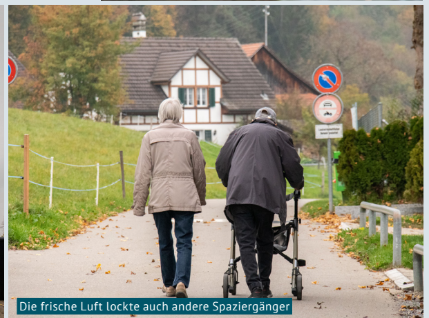
Die frische Luft lockte auch andere Spaziergänger