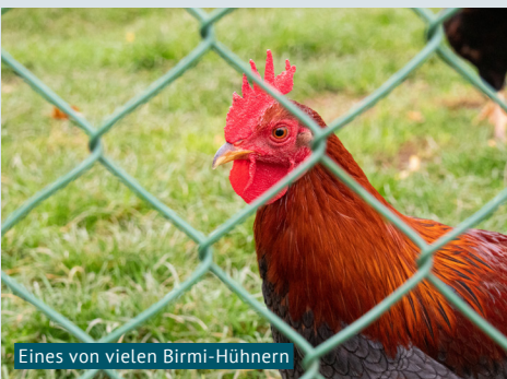
Eines von vielen Birmi-Hühnern