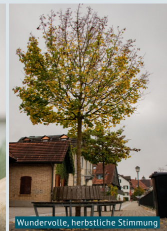
Wundervolle, herbstliche Stimmung