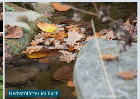
Herbstblätter im Bach