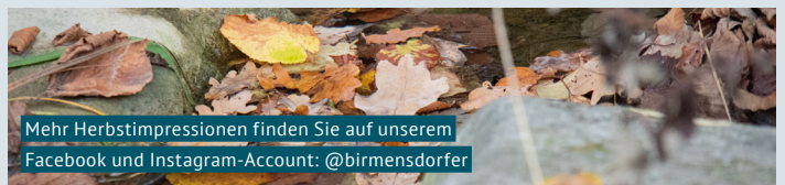
Mehr Herbstimpressionen finden Sie auf unserem Facebook und Instagram-Account: @birmensdorfer