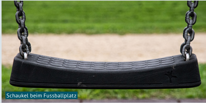
Schaukel beim Fussballplatz