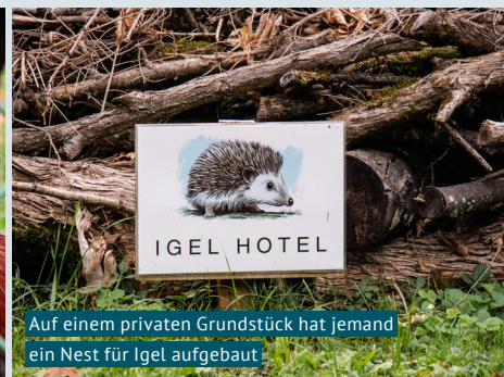
Auf einem privaten Grundstück hat jemand ein Nest für Igel aufgebaut