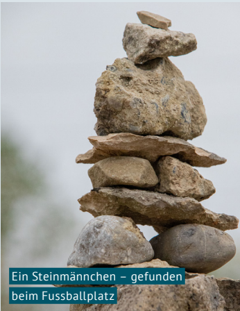
Ein Steinmännchen – gefunden beim Fussballplatz