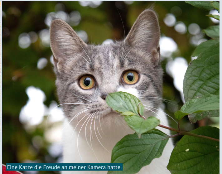
Eine Katze die Freude an meiner Kamera hatte.