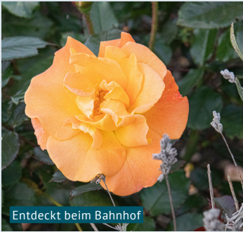
Entdeckt beim Bahnhof

Tiere aufgefallen, wie Eichhörnchen und Hühner. Die Stimmung änderte sich im Verlauf des Tages vom kalten, herbstlichen Morgen zu einem sonnigen Mittag. Lange konnte ich die Sonne aus Zeitgründen leider nicht geniessen. Gefreut hat es mich jedoch umso mehr, welche Motive sich mir mit der Sonne gezeigt haben.