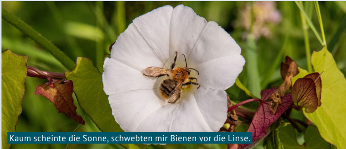
Kaum scheint die Sonne, schwebten mir Bienen vor die Linse.