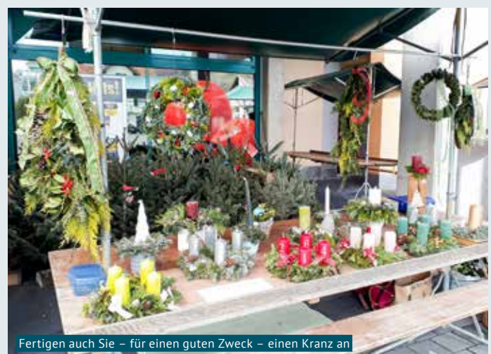
Fertigen auch Sie – für einen guten Zweck – einen Kranz an