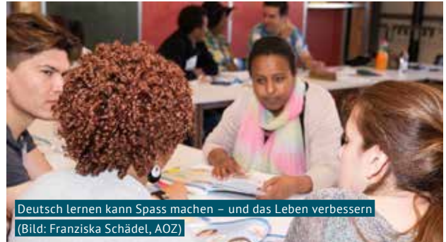
Deutsch lernen kann Spass machen – und das Leben verbessern

Der Deutschkurs der Gemeinde Birmensdorf und der AOZ findet am Dienstag- und Donnerstagmorgen im Gemeindezentrum Brüelmatt statt. Personen, die schon ein bisschen Deutsch sprechen sind herzlich willkommen. Für Eltern mit kleineren Kindern steht die Kinderbetreuung im Familienzentrum zur Verfügung.