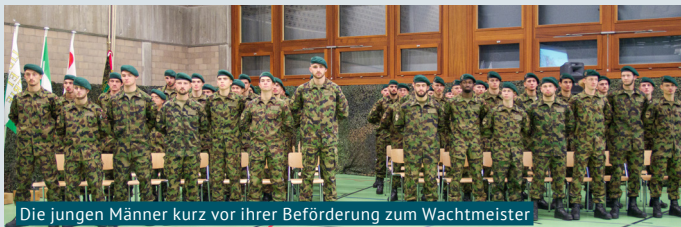
Die jungen Männer kurz vor ihrer Beförderung zum Wachtmeister