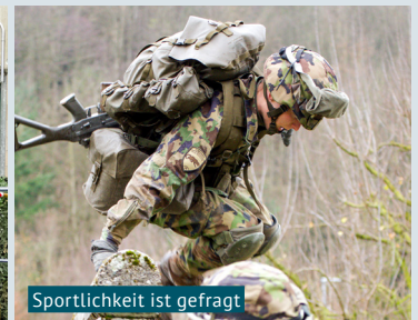
Sportlichkeit ist gefragt