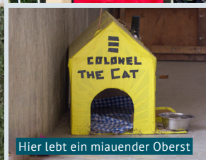
Hier lebt ein miauender Oberst