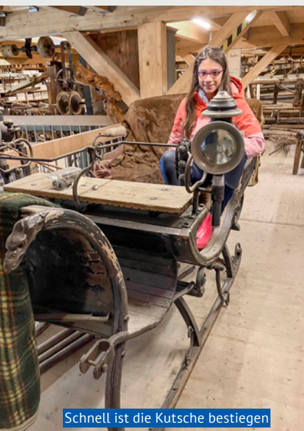
Schnell ist die Kutsche bestiegen