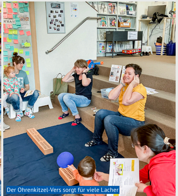
Der Ohrenkitzel-Vers sorgt für viele Lacher