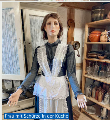
Frau mit Schürze in der Küche