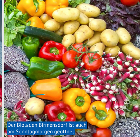
Der Bioladen Birmensdorf ist auch am Sonntagmorgen geöffnet