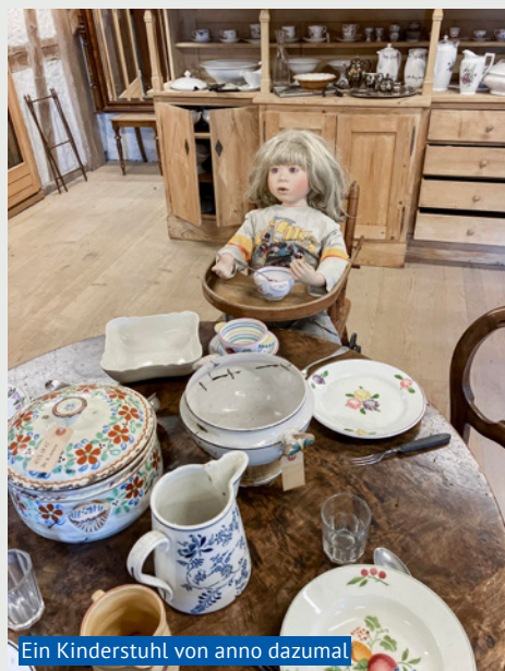
Ein Kinderstuhl von anno dazumal