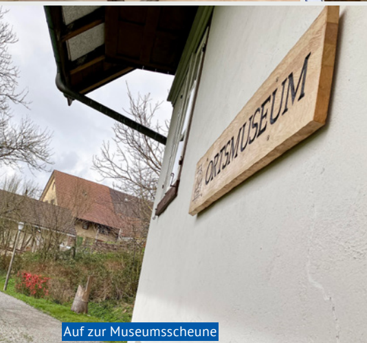
Auf zur Museumsscheune