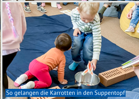
So gelangen die Karotten in den Suppentopf