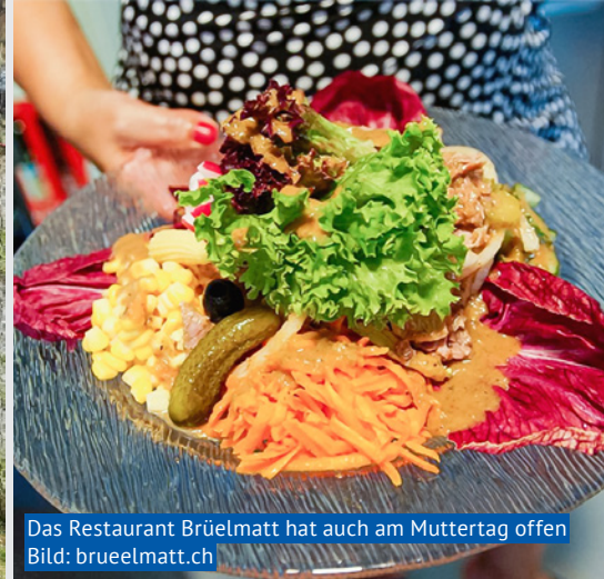
Das Restaurant Brüelmatt hat auch am Muttertag offen