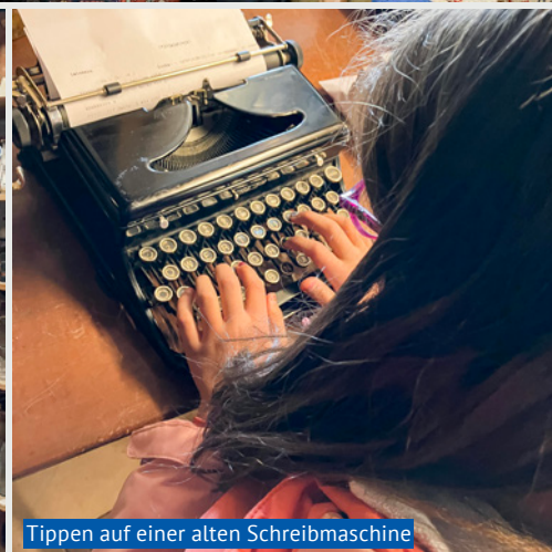
Tippen auf einer alten Schreibmaschine

Vom Ortsmuseum Birmensdorf führt eine Strasse zum Schopf. Und Kinderherzen schlagen nur schon wegen der davor aufgestellten Pferdeattrappe höher. Wer dann die Treppen hochsteigt, der wird mit Fundstücken aus vergangenen Zeiten belohnt. Diese werden aber nicht einfach in einer Vitrine präsentiert, sondern möglichst lebendig, wobei Puppenfiguren direkt in die Zeit von anno dazumal entführen.