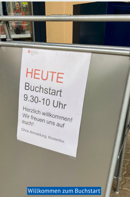
Willkommen zum Buchstart