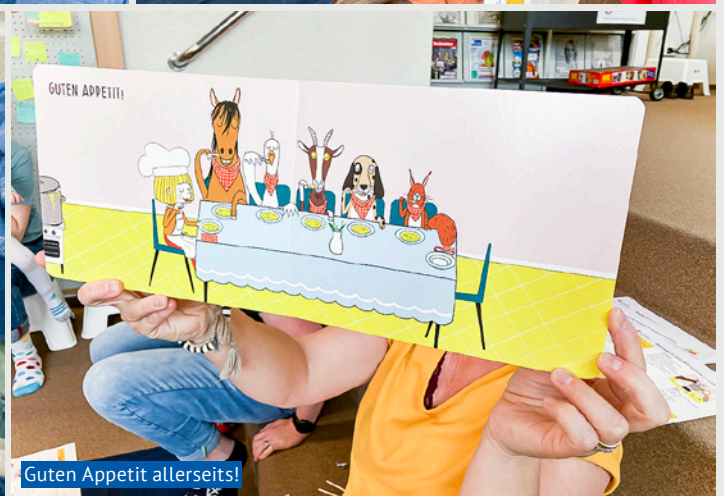
Guten Appetit allerseits!

Dienstagmorgen um 9.30 Uhr in der Gemeinde- und Schulbibliothek Birmensdorf: Mehrere Mütter, Grossmütter und ein Grossvater haben sich mit ihrem Kleinkindernachwuchs in die örtliche Bibliothek «verirrt», um beim sogenannten Buchstart mitzumachen. Geschichten, Reime und Fingerspiele sind schon für die Kleinsten das Tor zur Sprache. Und dank der spielerisch-leichten Präsentation fällt es allen Anwesenden leicht, in die Welt eines Kinderbuches einzutauchen.