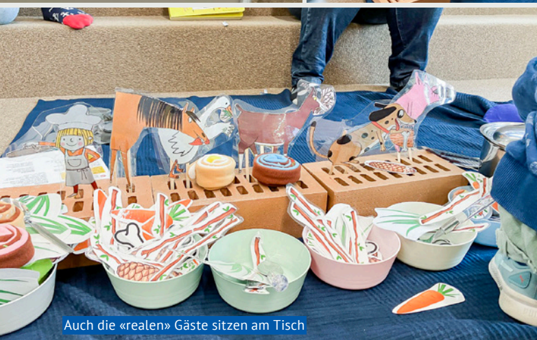
Auch die «realen» Gäste sitzen am Tisch