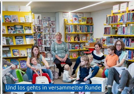
Und los gehts in versammelter Runde