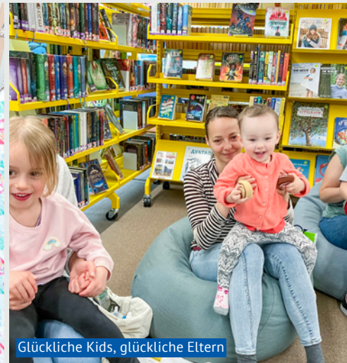
Glückliche Kids, glückliche Eltern