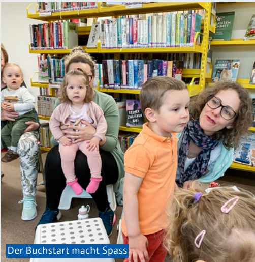
Der Buchstart macht Spass