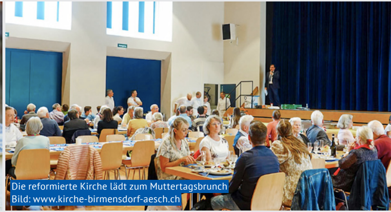
Die reformierte Kirche lädt zum Muttertagsbrunch