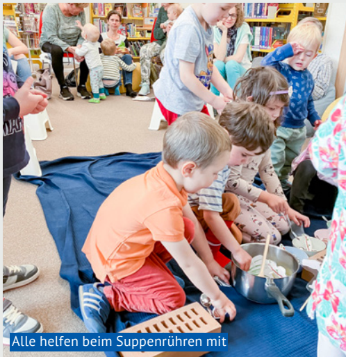
Alle helfen beim Suppenrühren mit