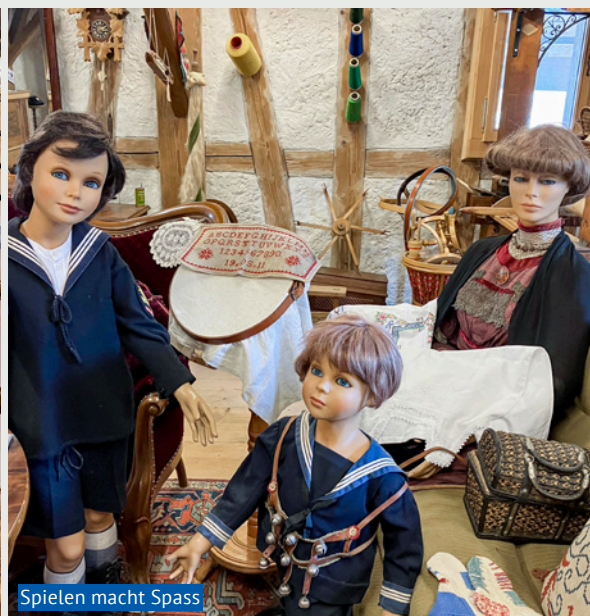
Spielen macht Spass