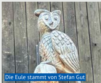
Die Eule stammt von Stefan Gut