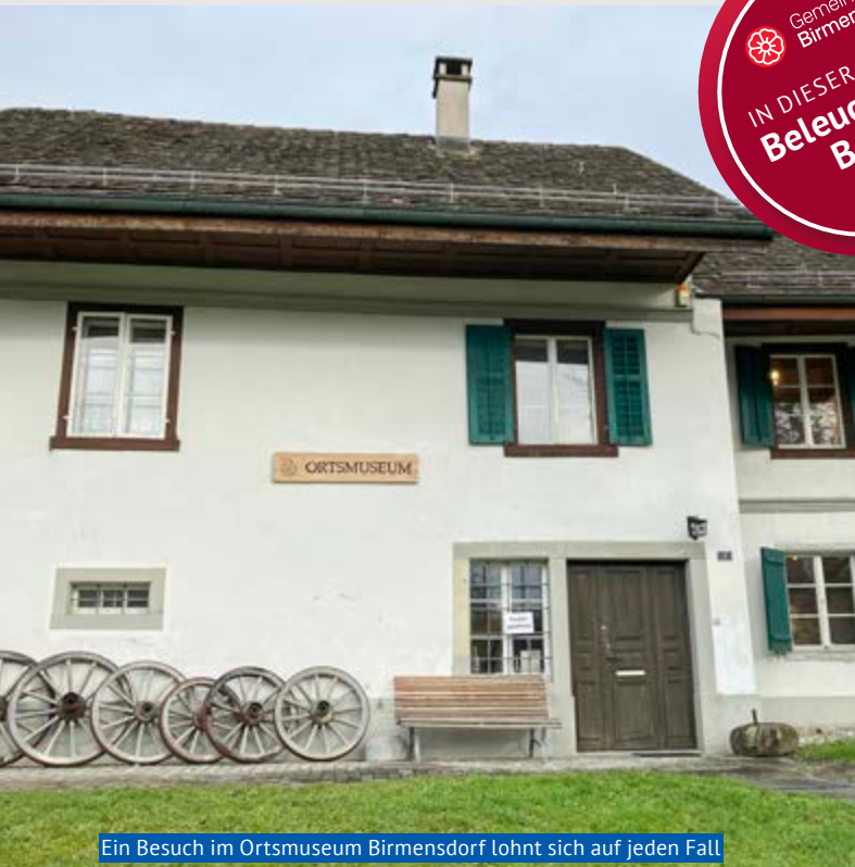
Ein Besuch im Ortsmuseum Birmensdorf lohnt sich auf jeden Fall