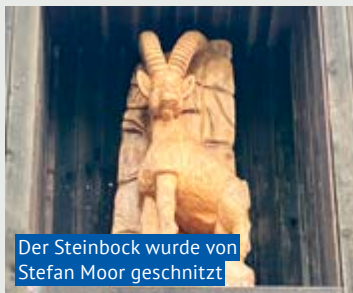
Der Steinbock wurde von Stefan Moor geschnitzt