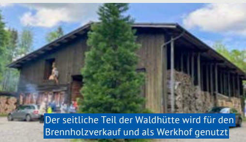
Der seitliche Teil der Waldhütte wird für den Brennholzverkauf und als Werkhof genutzt