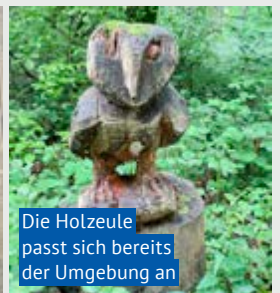
Die Holzzeule passt sich bereits der Umgebung an