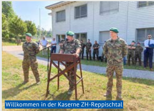
Willkommen in der Kaserne ZH-Reppischtal