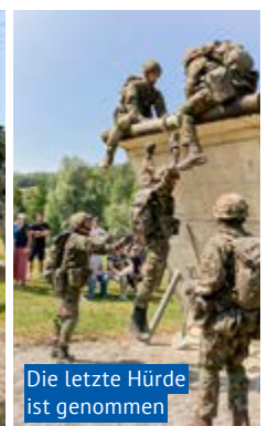
Die letzte Hürde ist genommen