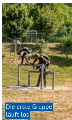
Die erste Gruppe läuft los