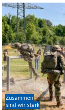
Zusammen sind wir stark