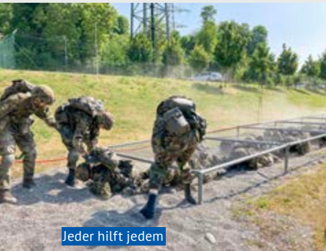
Jeder hilft jedem