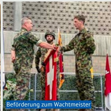
Beförderung zum Wachtmeister