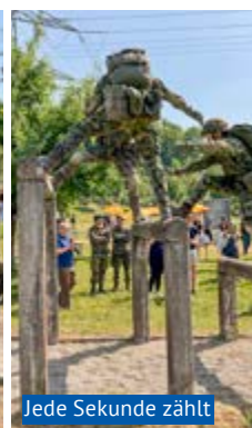
Jede Sekunde zählt