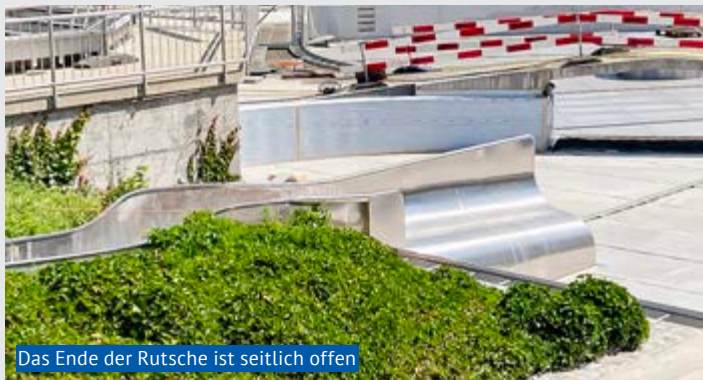
Das Ende der Rutsche ist seitlich offen