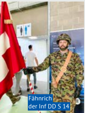
Fähnrich der Inf DD S 14