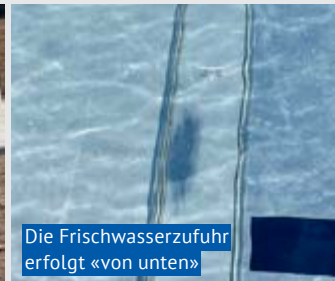
Die Frischwasserzufuhr erfolgt «von unten»