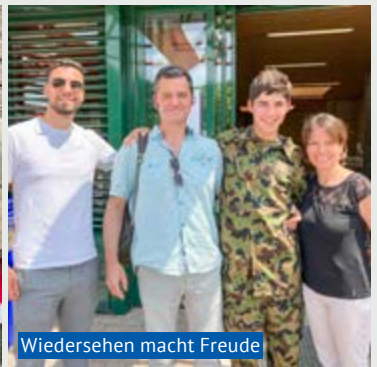
Wiedersehen macht Freude

Zum Auftakt ging es am vergangenen Samstagmorgen für jede Gruppe darum, mit vereinten Kräften eine Hindernisbahn auf der Wiese der Kaserne nahe bei Birmensdorf zu bewältigen – notabene bei heissem Vorsommerwetter. Zusammen laufen, zusammen robben und sich gegenseitig helfen: Teamgeist war schon bei dieser einleitenden Demo-Übung von zentraler Bedeutung. Und auch in den späteren Ansprachen wurde immer wieder betont, wie wichtig eine gute Kameradschaft im Militär ist. Auch die Wichtigkeit der Institution angesichts der aktuellen Weltlage mit Ukraine-, Energie- und anderen Krisen wurde getreu dem Plakat-Slogan «Wir dienen» mehrmals betont.