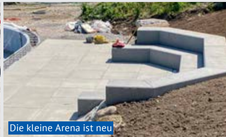
Die kleine Arena ist neu