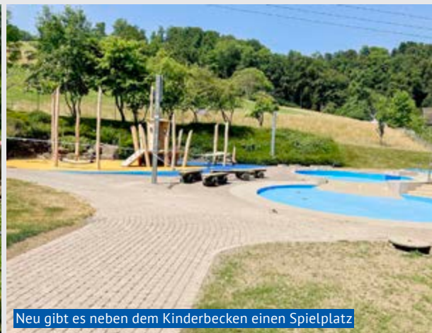
Neu gibt es neben dem Kinderbecken einen Spielplatz