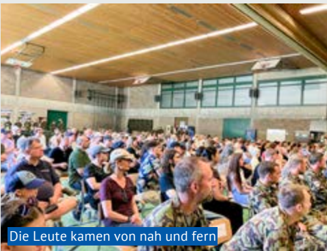
Die Leute kamen von nah und fern