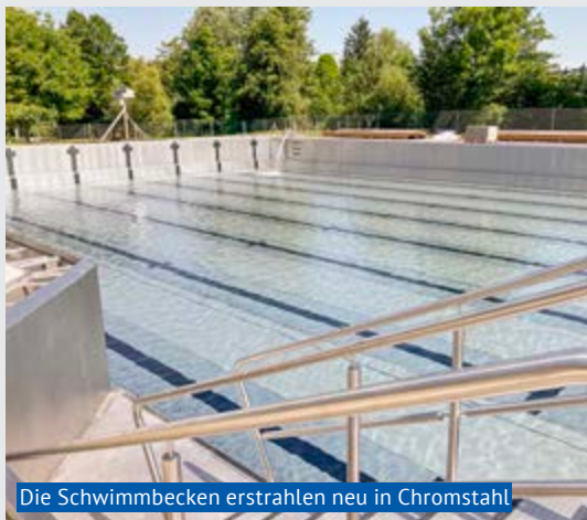
Die Schwimmbecken erstrahlen neu in Chromstahl