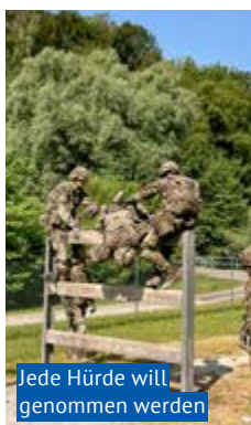
Jede Hürde will genommen werden