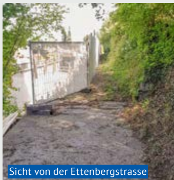
Sicht von der Ettenbergstrasse