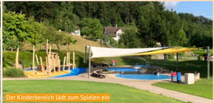
Der Kinderbereich lädt zum Spielen ein