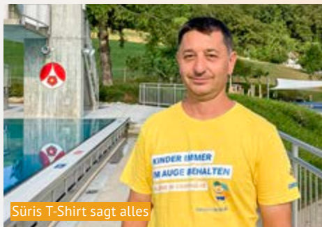
Süris T-Shirt sagt alles