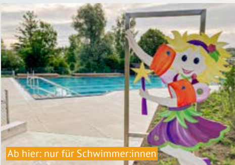
Ab hier: nur für Schwimmer:innen