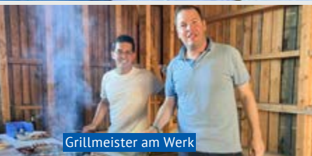
Grillmeister am Werk