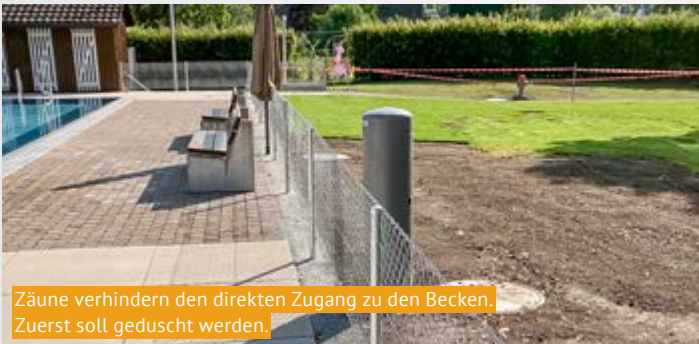
Zäune verhindern den direkten Zugang zu den Becken. Zuerst soll geduscht werden.