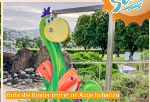
Bitte die Kinder immer im Auge behalten