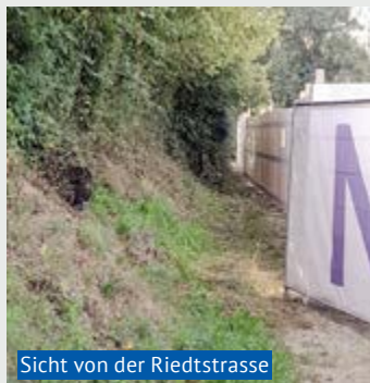
Sicht von der Riedtstrasse

Es freut mich, Ihnen, liebe Bewohner:innen, mitteilen zu können, dass der Wüeritalweg zwischen der Riedt- und Ettenberstrasse ab Samstag, 22. Juli 2023 wieder geöffnet wird. Somit ist die über Monate andauernde Sperrung des Weges wegen einer Baustelle mit Hangsicherungen unmittelbar unterhalb des Weges zu Ende. Geniessen Sie die Natur im wunderschönen Wüerital.