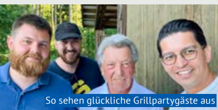
So sehen glückliche Grillpartygäste aus