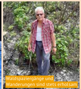
Waldspaziergänge und Wanderungen sind stets erholend