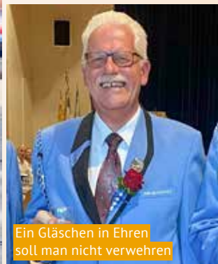
Ein Gläschen in Ehren soll man nicht verwehren