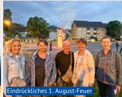
Eindrückliches 1. August-Feuer