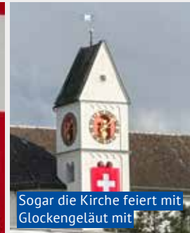
Sogar die Kirche feiert mit Glockengeläut mit