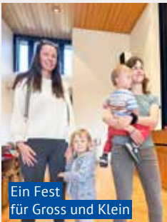
Ein Fest für Gross und Klein