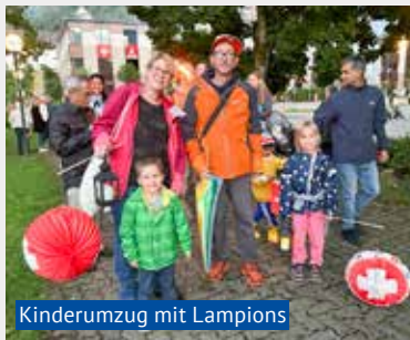
Kinderumzug mit Lampions