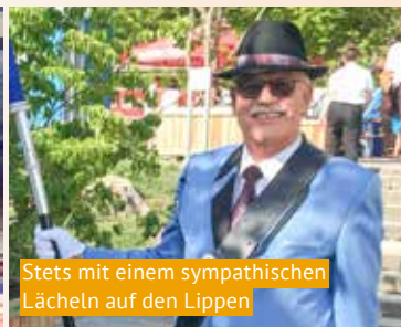
Stets mit einem sympathischen Lächeln auf den Lippen