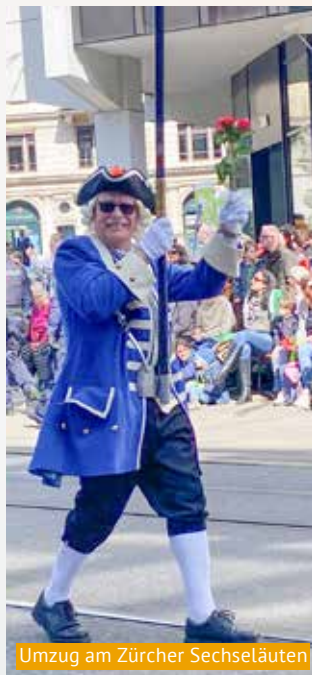
Umzug am Zürcher Sechseläuten