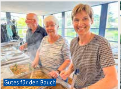
Gutes für den Bauch