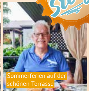
Sommerferien auf der schönen Terrasse