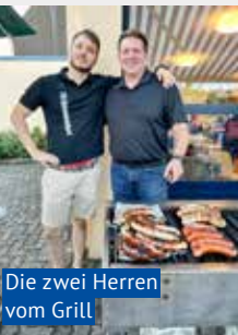
Die zwei Herren vom Grill