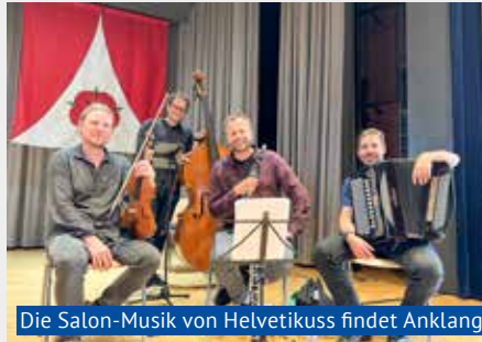
Die Salon-Musik von Helvetikuss findet Anklang