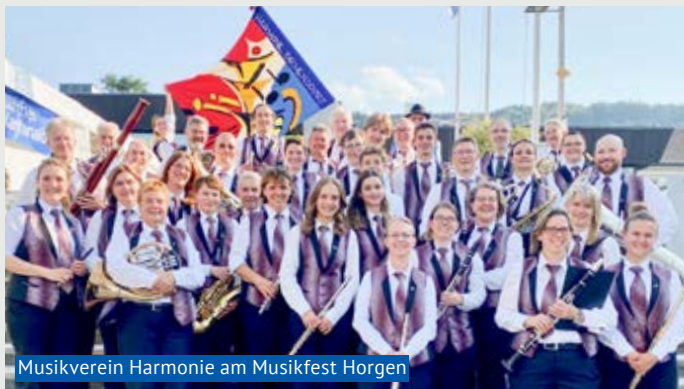
Musikverein Harmonie am Musikfest Horgen

Erinnern Sie sich an die Melodien Simply The Best, Dirty Dancing, Highlights from «Cats», an eine Epoche voller schillernden Kleidern und Erfindungen, welche die Welt veränderten? Der Musikverein Harmonie führt Sie Ende November/ anfangs Dezember (siehe. Agenda und Webseite) mit diesen und weiteren Musikstücken in die wilde Epoche der 80er-Jahre zurück.