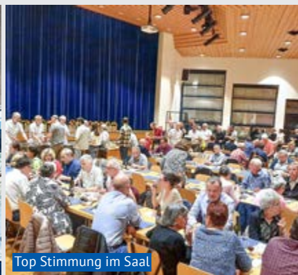
Top Stimmung im Saal