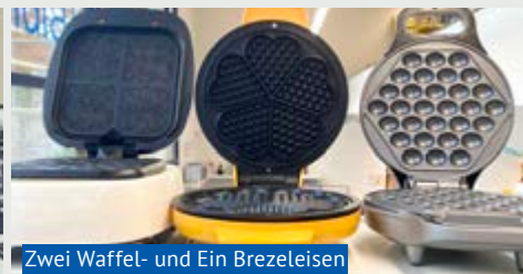
Zwei Waffel- und Ein Brezeleisen