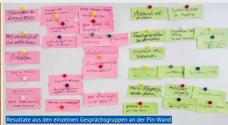
Resultate aus den einzelnen Gesprächsgruppen an der Pin-Wand