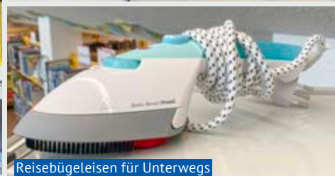
Reisebügelleisen für unterwegs