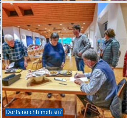
Dörfs no chli meh sii?