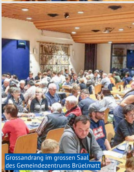
Grossandrang im grossen Saal des Gemeindezentrums Brüelmatt