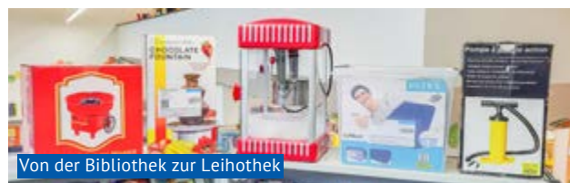
Von der Bibliothek zur Leihothek