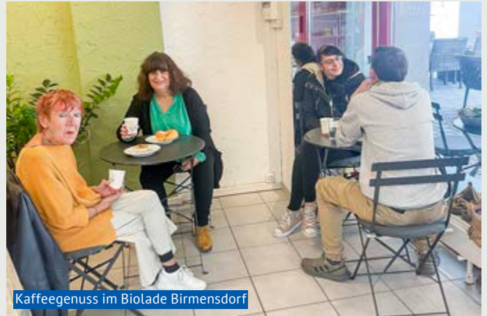
Kaffeegenuss im Biolade Birmensdorf

Seit einem Jahr bieten wir der Birmensdorfer Bevölkerung bereits unsere Bio-Produkte an. Am Samstag, dem 4. November findet unsere Jubiläumsfeier statt.