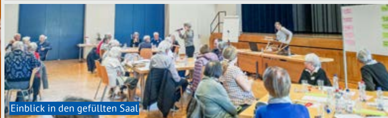
Einblick in den gefüllten Saal