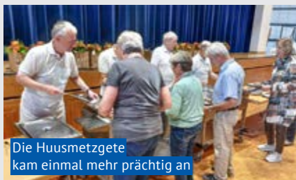
Die Huusmetzgete kam einmal mehr prächtig an