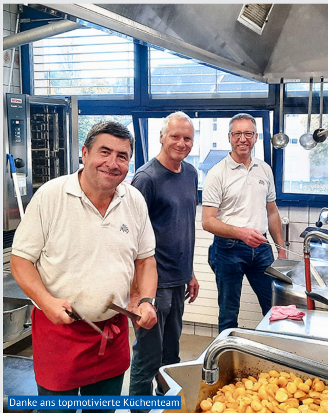
Danke ans topmotivierte Küchenteam