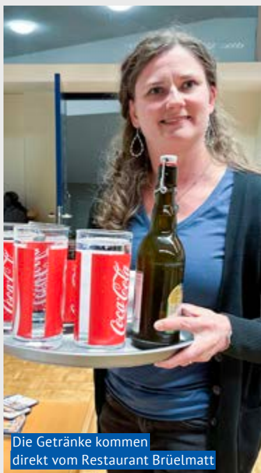
Die Getränke kommen direkt vom Restaurant Brüelmatt