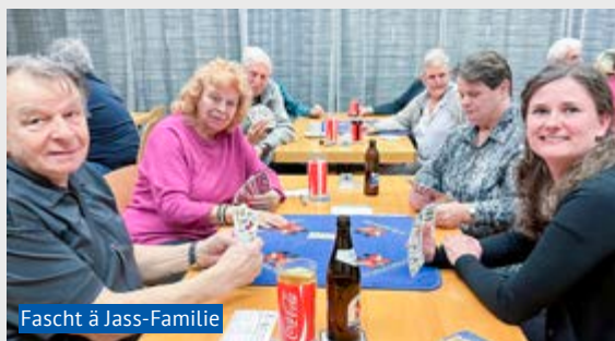
Fascht ä Jass-Familie