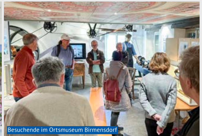
Besuchende im Ortsmuseum Birmensdorf