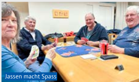
Jassen macht Spass