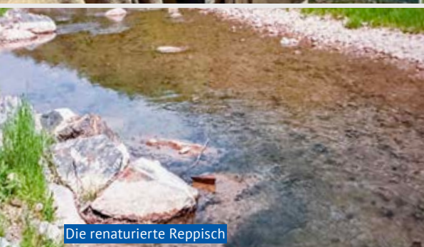
Die renaturierte Reppisch