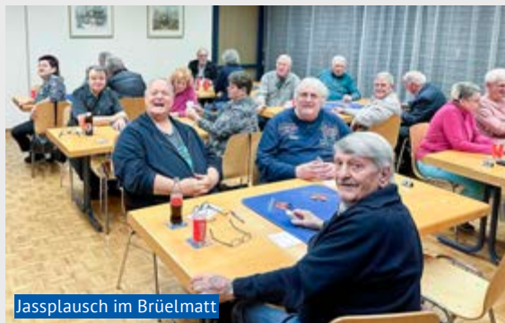
Jassplausch im Brüelmatt