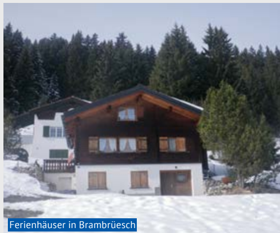
Ferienhäuser in Brambrüesch