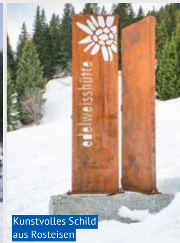
Kunstvolles Schild aus Rosteisen

Von der Skilift-Talstation führte die Wanderung zuerst ein Stück weit am Pistenrand entlang, bis er links Richtung Mittelmaiensäss abzweigte. Mit Schnee bezuckerte Tannen säumen den Weg und zwischen den Waldabschnitten wird der Blick frei auf die umliegende Berglandschaft. Die Gipfel der Lenzerheide mit dem Parpaner Rothorn markieren den blauen Horizont. Besonders idyllisch ist die Landschaft bei Seznis, wo die Sicht bis zum Dreibündenstein frei wird. Bei der Edelweisschütte ist der höchste Punkt auf 1712 Metern erreicht. Nun wanderte man et-