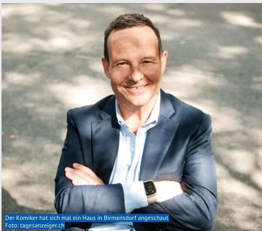
Der Komiker hat sich mal ein Haus in Birmensdorf angeschaut