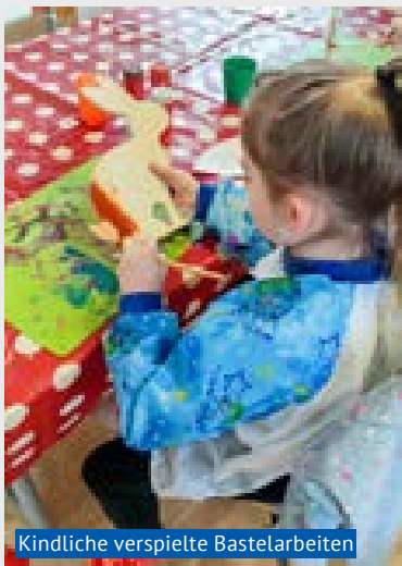
Kindliche verspielte Bastelarbeiten