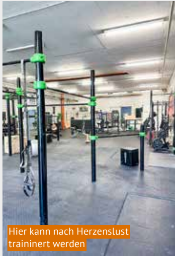
Hier kann nach Herzenslust trainiert werden