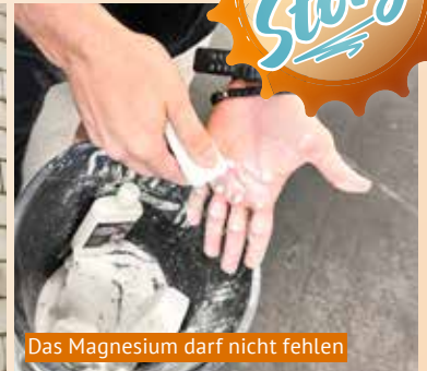
Das Magnesium darf nicht fehlen