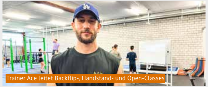
Trainer Ace leitet Backflip-, Handstand- und Open-Clauses