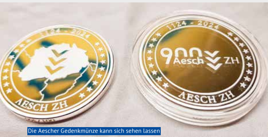
Die Aescher Gedenkmünze kann sich sehen lassen