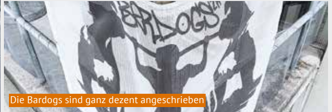
Die Bardogs sind ganz dezent angeschrieben