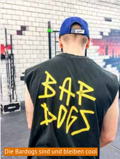
Die Bardogs sind und bleiben cool