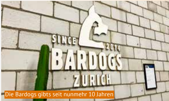
Die Bardogs gibts seit nunmehr 10 Jahren