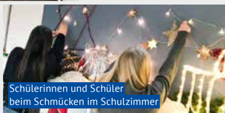
Schülerinnen und Schüler beim Schmücken im Schulzimmer