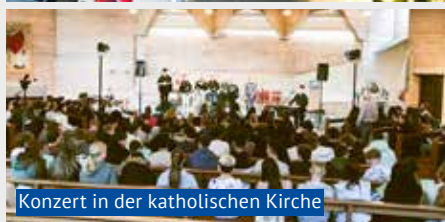
Konzert in der katholischen Kirche

Es ist wieder soweit, die Schulzimmer der Sekundarschule Birmensdorf Aesch glitzern und funkeln in weihnachtlichem Glanz. Am Freitag, 29. November verwandelten alle Klassen ihre Klassenzimmer und die Gänge in eine weihnachtliche Stimmung. Bereits zwei Wochen vorher organisierte das Schülerparlament den Ablauf für die Weihnachtsdeko, damit alles pünktlich bereit lag. Emsig schnitten, klebten und verzierten die Schülerinnen und Schüler Papier und schmückten mit ihren Kreationen die Klassenzimmertüren. In den Schulzimmern wurden Christbäume dekoriert, Fenster verziert und Lichterketten aufgehängt. In den Gängen wurden ebenfalls die grösseren Weihnachtsbäume verschönert und leuchtende Sterne aufgehängt. Es war eine friedliche, arbeitsame und besinnliche Stimmung im Schulhaus. Wir laden alle herzlich ein, einen Blick in das weihnachtlich verwandelte Schulhaus zu werfen.