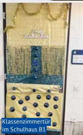
Klassenzimmertür im Schulhaus B1