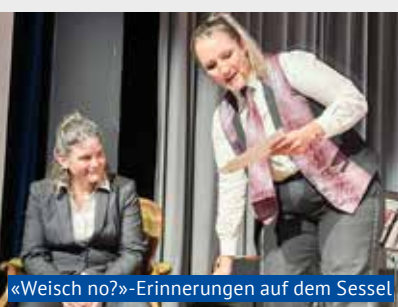
«Weisch no?»-Erinnerungen auf dem Sessel