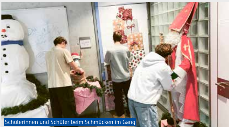
Schülerinnen und Schüler beim Schmücken im Gang