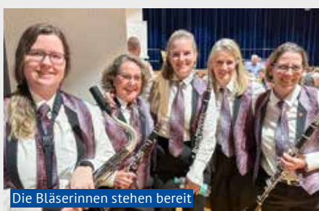
Die Bläserinnen stehen bereit