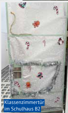
Klassenzimmertür im Schulhaus B2