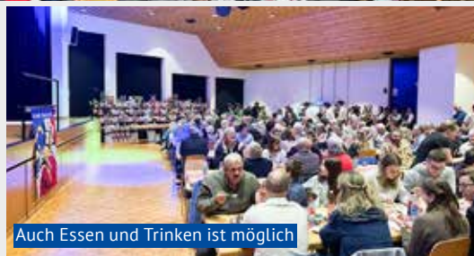
Auch Essen und Trinken ist möglich