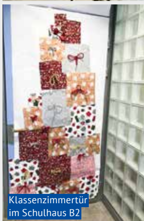
Klassenzimmertür im Schulhaus B2