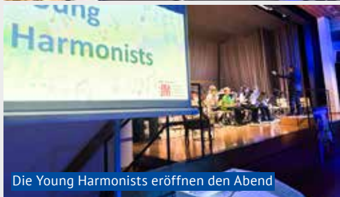
Die Young Harmonists eröffnen den Abend