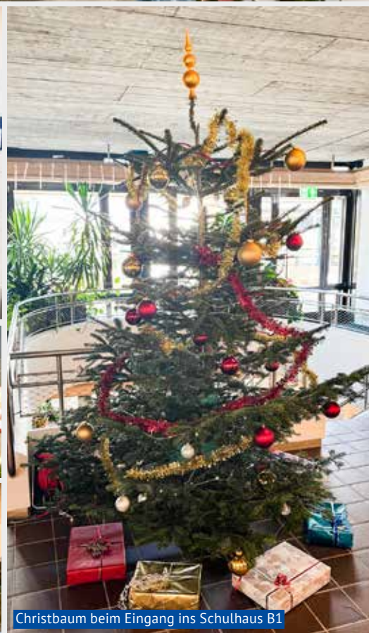
Christbaum beim Eingang ins Schulhaus B1