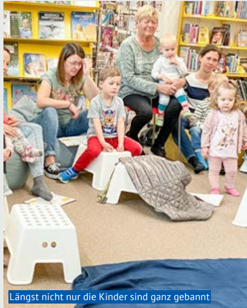
Längst nicht nur die Kinder sind ganz gebannt