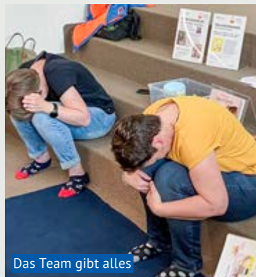
Das Team gibt alles