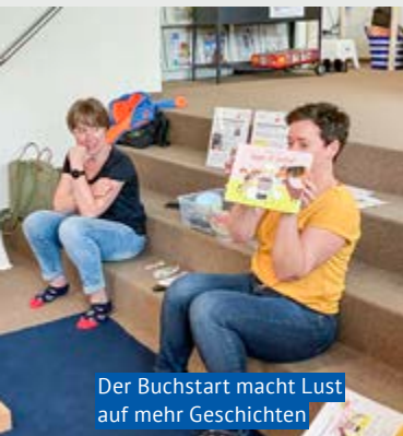
Der Buchstart macht Lust auf mehr Geschichten