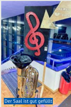
Der Saal ist gut gefüllt