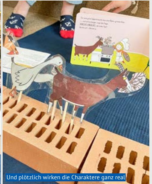
Und plötzlich wirken die Charaktere ganz real