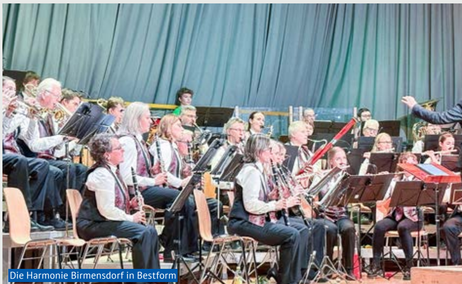
Die Harmonie Birmensdorf in Bestform