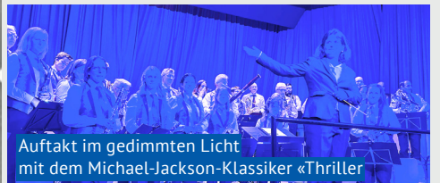
Auftakt im gedimmten Licht mit dem Michael-Jackson-Klassiker «Thriller»