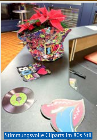
Stimmungsvolle Cliparts im 80s Stil