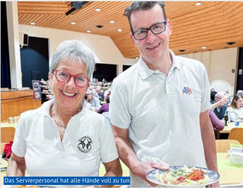
Das Servierpersonal hat alle Hände voll zu tun