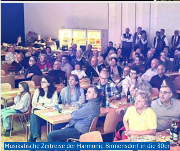
Musikalische Zeitreise der Harmonie Birmensdorf in die 80er