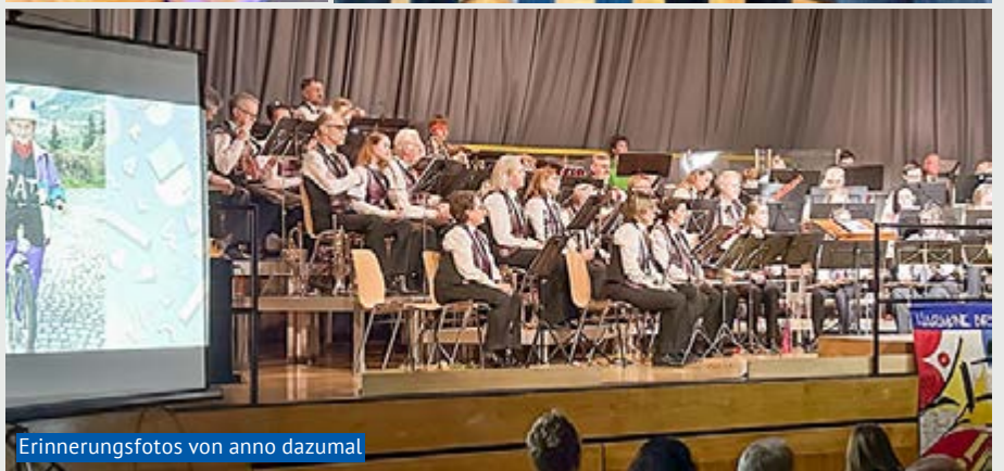
Erinnerungsfotos von anno dazumal