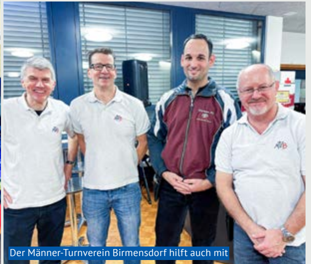
Der Männer-Turnverein Birmensdorf hilft auch mit