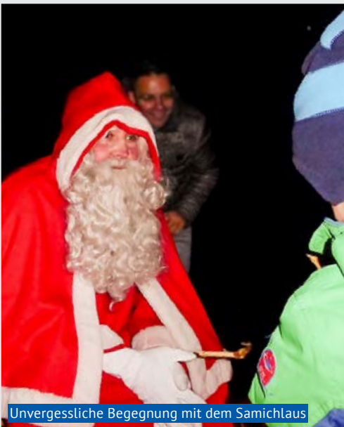
Unvergessliche Begegnung mit dem Samichlaus