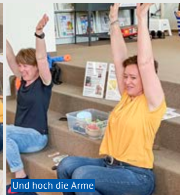
Und hoch die Arme