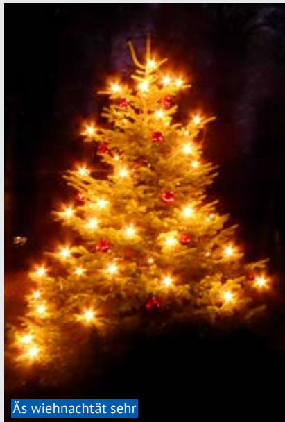
Äs wiennachtät sehr