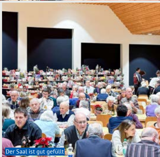
Der Saal ist gut gefüllt

In ihrer Ansprache im Birmensdorfer Gemeindezentrum Brüel-matt gaben die Young Harmonists offen zu, dass sie viele Eighties-Hits wegen ihres jungen Alters noch nicht miterlebten. «Musik aus einem Land vor unserer Zeit» meinten sie ironisch und erteten dafür schon mal heftigen Publikumsapplaus. Ihr Auftritt überzeugte und ebnete den Weg für die Harmonie Birmensdorf, welche anschliessend mit Pauken und Trompeten dem Michael-Jackson-Klassiker «Thriller» huldigte. Passend dazu wurde das Bühnenlicht gedimmt und auf der eigens aufgestellten Beamer-Leinwand war eine geheimnisvolle Waldstimmung zu sehen: Hinter jedem Baum könnte schliesslich ein «Thriller»-Vampir lauern... Wenige Augenblicke später gabs Stimmungswechsel pur mit einer deutschen Eighties-Hits-Kulttour, dem Louenensee-Oldie, «Simply the Best»-Evergreen von Tina Turner und «Jump» von Van Halen.