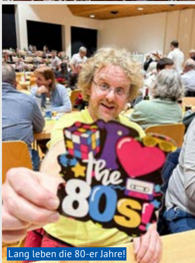
Lang leben die 80-er Jahre!