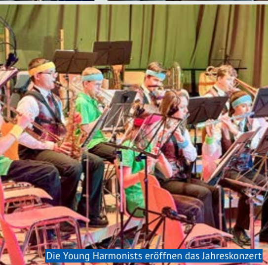
Die Young Harmonists eröffnen das Jahreskonzert