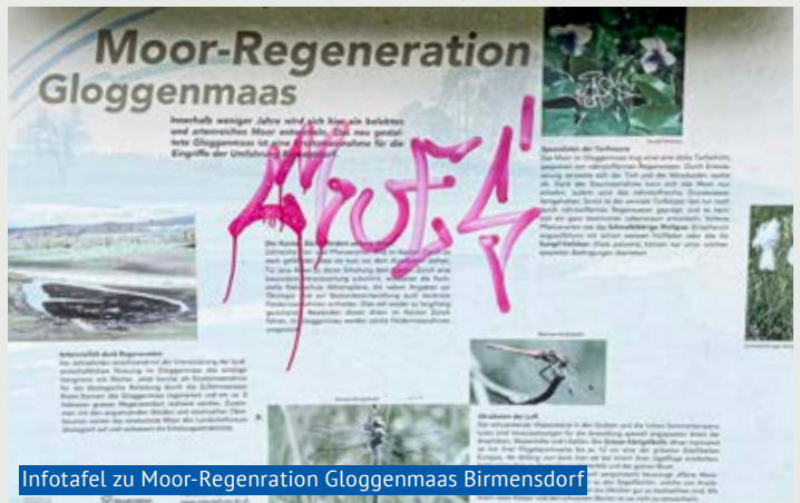
Infotafel zu Moor-Regeneration Gloggenmaas Birmensdorf

Bin ich einfach zu alt? Verstehe ich die tieferen Zusammenhänge und Beweggründe dieser Schriftzüge und Spraysignete nicht? Was geht in dieser Person vor, wenn sie sich auf Infotafeln verewigt und es dem Leser oder der Leserin schwierig macht, sich zu informieren über die Entstehung des Moors Gloggenmaas oder über Forschungen zur Lichtverschmutzung? Kann jemand die Zeichen entziffern? Oder haben die Verursachenden gar den