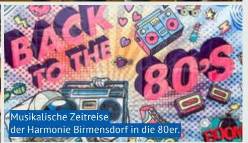
Musikalische Zeitreise der Harmonie Birmensdorf in die 80er.