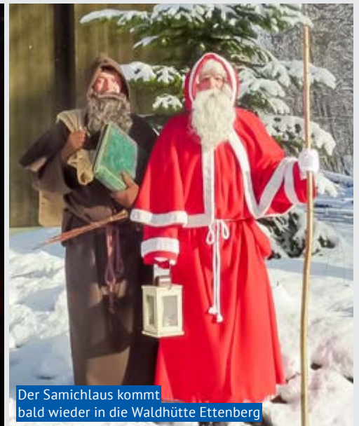
Der Samichlaus kommt bald wieder in die Waldhütte Ettenberg