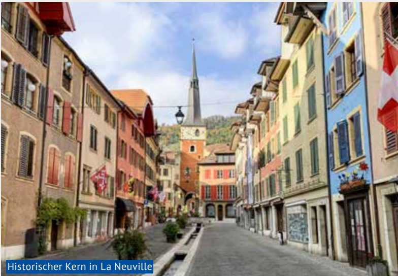
Historischer Kern in La Neuveville