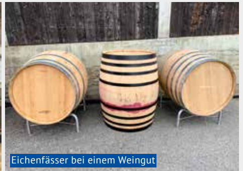
Eichenfässer bei einem Weingut