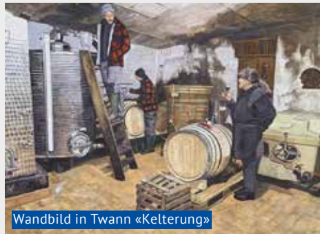
Wandbild in Twann «Kelterung»