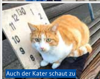
Auch der Kater schaut zu