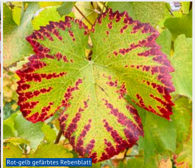
Rot-gelb gefärbtes Rebenblatt

Seniorinnen und Senioren von Birmensdorf und Umgebung starteten am Bahnhof Tüscherz auf einer Teilstrecke des beliebten Rebenwegs am nördlichen Ufer des Bielersees, mit einem schönen Berg- und Seepanorama. Nach etwas mehr als einer Stunde erreichte man das Winzerdorf Twann, mit seinem gepflegten Ortsbild und kunstvollen Wandbildern. Im Hotel Bären gab es das Mittagessen nach eigener Wahl: vegetarischer Herbstteller mit Rotkraut, karamellisierten Kastanien, Rosenkohl, Steinpilzen, Apfel «Mirza», Trauben, Kürbis-Chutney, Spätzli und Rahmsauce oder sämiges Risotto mit Waldpilzen und Kürbis-Chutney.