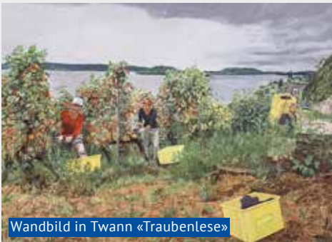
Wandbild in Twann «Traubenlese»