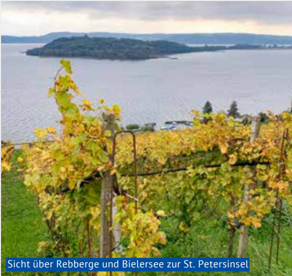
Sicht über Rebberge und Bielersee zur St. Petersinsel