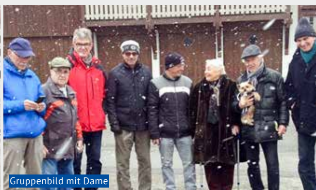
Gruppenbild mit Dame