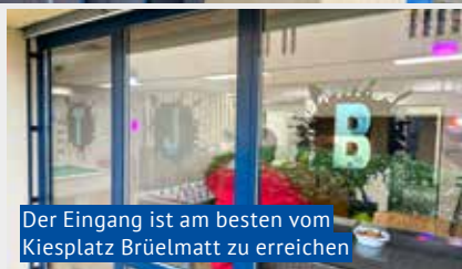
Der Eingang ist am besten vom Kiesplatz Brüelmatt zu erreichen