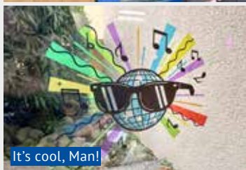
It's cool, Man!