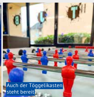
Auch der Töggelikasten steht bereit