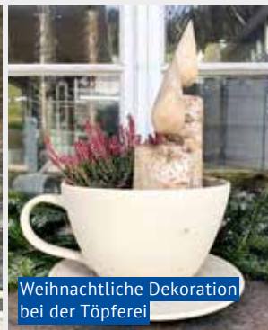
Weihnachtliche Dekoration bei der Töpferei