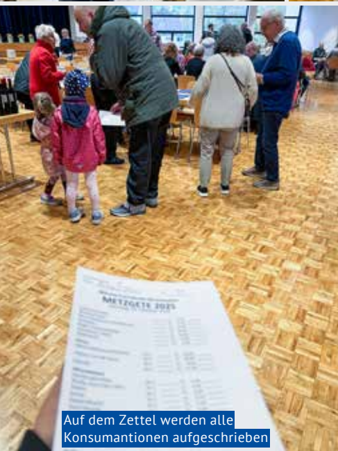
Auf dem Zettel werden alle Konsumationen aufgeschrieben