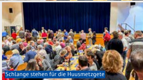
Schlange stehen für die Huusmetzgete