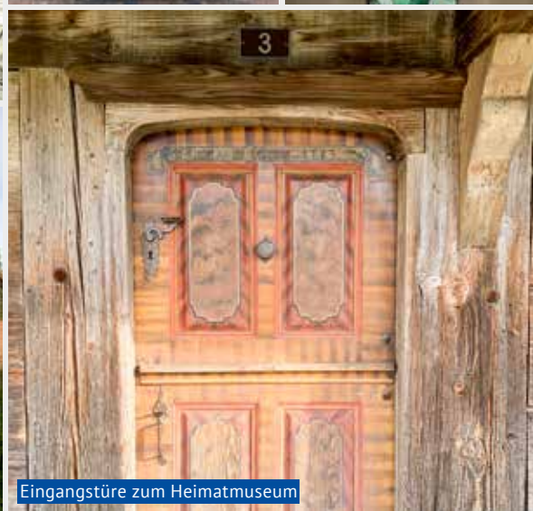
Eingangstüre zum Heimatmuseum

Mitten im idyllischen Emmental kann man in die Welt von Kambly eintauchen und mit allen Sinnen im erlebnisreichen Begegnungsort die Geheimnisse der Feingebäck-Kunst entdecken. Hier kann man den Ursprung von Kambly und die Erlebniswelt auf spielerische Weise erkunden und im Fabrikladen, Café und in der Confiserie Momente der Freude geniessen.