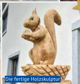
Die fertige Holzskulptur