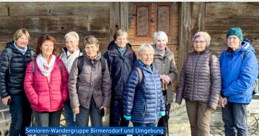
Senioren-Wanderguppe Birmensdorf und Umgebung