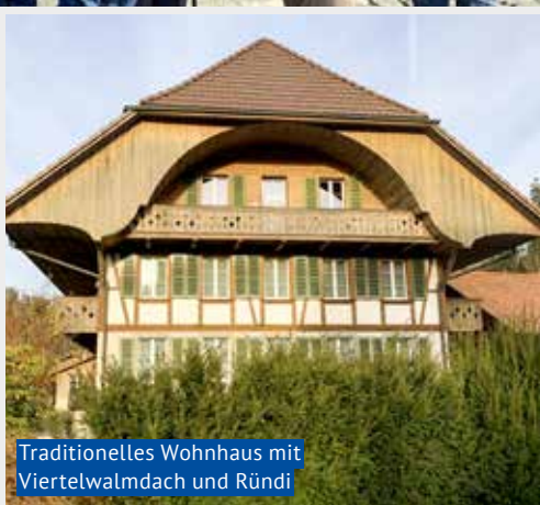
Traditionelles Wohnhaus mit Viertelwalmdach und Ründi