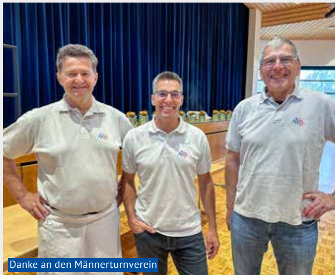
Danke an den Männerturnverein