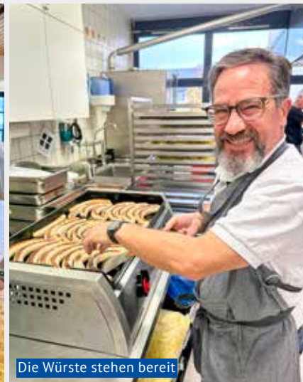
Die Würste stehen bereit