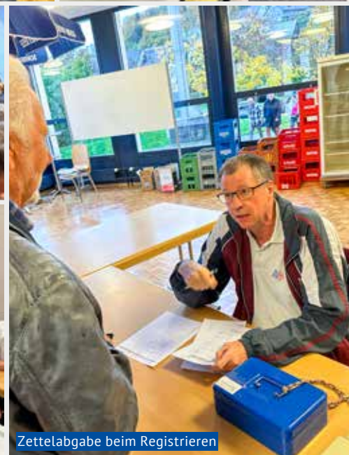
Zettelabgabe beim Registrieren

«Ufschlüsse, ich han Hunger!» hallte es am Samstagabend durch die grosse Halle des Gemeindezentrums Brüelmatt. Auch die 42. Metzgete des Männerturnvereins Birmensdorf lockte erneut zahlreiche Gäste an, sodass sich schnell eine Warteschlange bildete. Aber dank personalisiertem Zettel in der Hand verkürzte sich die Wartezeit im Nu. Der Männerturnverein hat einmal mehr ganze Arbeit geleistet und die Organisation im Griff.