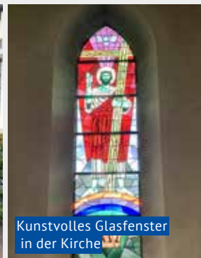
Kunstvolles Glasfenster in der Kirche