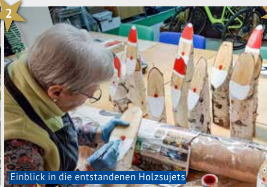
Einblick in die entstandenen Holz Sujets