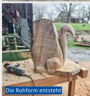
Die Rohform entsteht