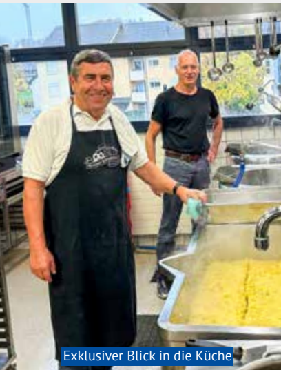
Exklusiver Blick in die Küche