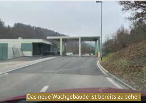
Das neue Wachgebäude ist bereits zu sehen