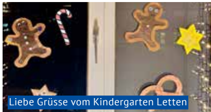
Liebe Grüsse vom Kindergarten Letten