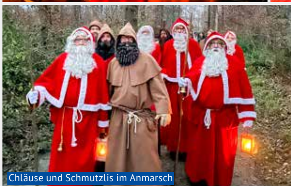
Chläuse und Schmutzlis im Anmarsch