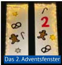
Das 2. Adventsfenster