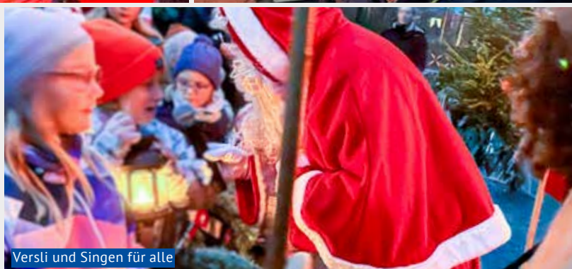
Versli und Singen für alle

Langsam legt sich vor der Waldhütte Ettenberg eine gespannte Ruhe über den dunklen Forst. Familien, Kinder und Freunde stehen dicht beisammen, eingehüllt in Jacken und Schals, während der Duft von heissem Punch, Bratwürsten und frischem Tannengrün durch die kalte Abendluft zieht. Die montierten Lichter werfen lange Schatten zwischen die Bäume, und leise mischen sich erwartungsvolle Stimmen mit dem Rascheln des Waldes. Jeder weiss, gleich ist es so weit: