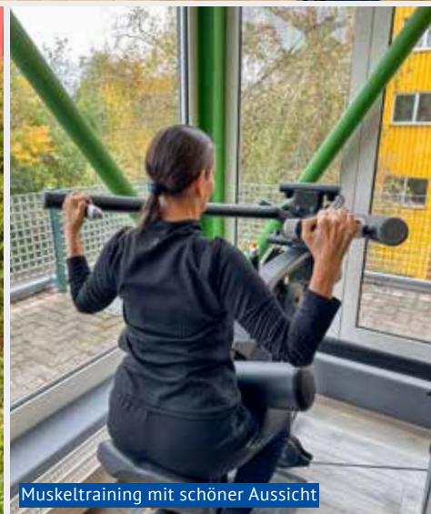
Muskeltraining mit schöner Aussicht

Das vielseitige Sportzentrum bietet alles, was Fitnessbegeisterte suchen: moderne Trainingsmöglichkeiten, ein lebendiges Umfeld und eine Atmosphäre, in der sich alle Generationen zu Hause fühlen. Hier trainieren Junge mit Erfahrenen, Anfänger mit Profis, Freizeitathleten mit ambitionierten Sportlern – vereint durch das gleiche Ziel: aktiv bleiben, sich wohlfühlen und über sich hinauswachsen.