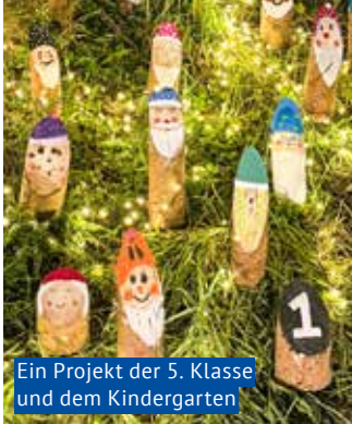
Ein Projekt der 5. Klasse und dem Kindergarten