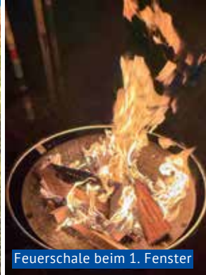
Feuerschale beim 1. Fenster