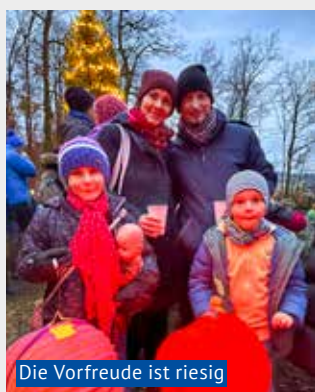
Die Vorfreude ist riesig