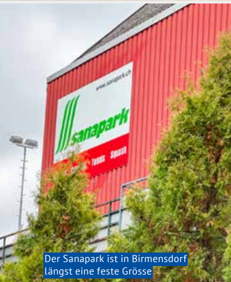
Der Sanapark ist in Birmensdorf längst eine feste Grösse