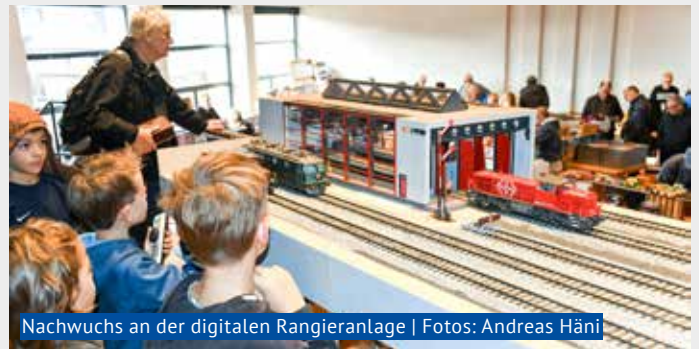
Nachwuchs an der digitalen Rangieranlage