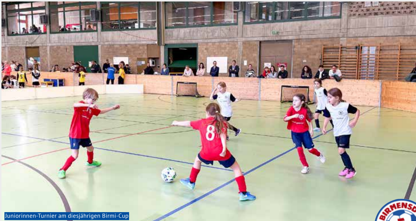
Juniorinnen-Turnier am diesjährigen Birmi-Cup