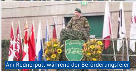
Am Rednerpult während der Beförderungsfeier