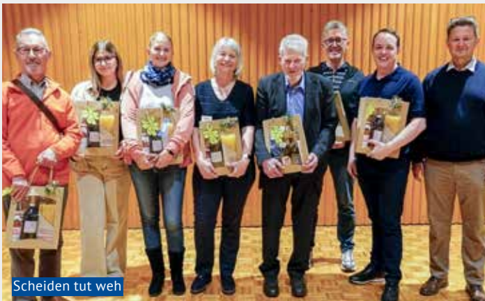
Scheiden tut weh