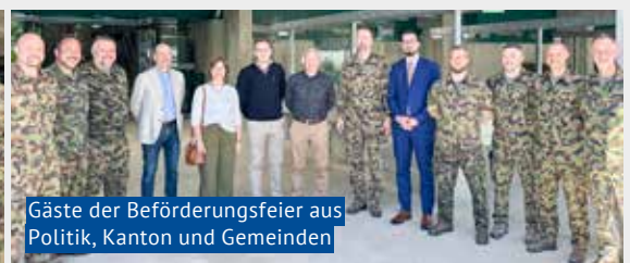
Gäste der Beförderungsfeier aus Politik, Kanton und Gemeinden