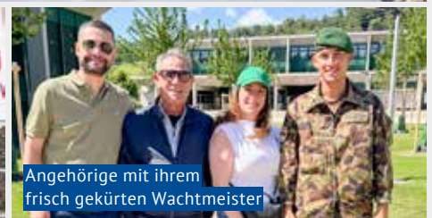
Angehörige mit ihrem frisch gekürten Wachtmeister