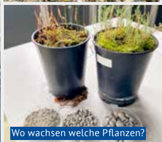
Wo wachsen welche Pflanzen?