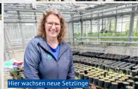
Hier wachsen neue Setzlinge

Der Wasserlauf beginnt unscheinbar. Ein leises Rauschen, kaum lauter als ein Gartenbrunnen, zieht sich durch die Halle der WSL in Birmensdorf. Doch was hier durch einen zehn Meter langen Strömungskanal fließt, ist mehr als Wasser: Es ist ein Experiment, um das Schicksal der Schweizer Auen besser zu verstehen.