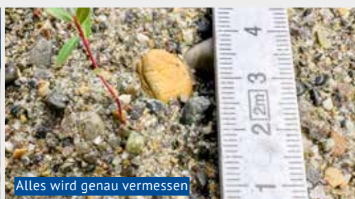
Alles wird genau vermessen