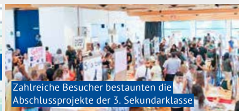
Zahlreiche Besucher bestaunten die Abschlussprojekte der 3. Sekundarklasse