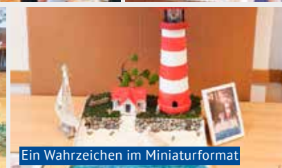
Ein Wahrzeichen im Miniaturformat