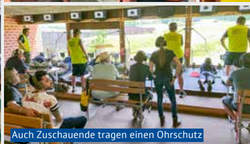
Auch Zuschauende tragen einen Ohrschutz