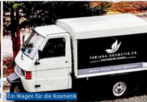
Ein Wagen für die Kosmetik