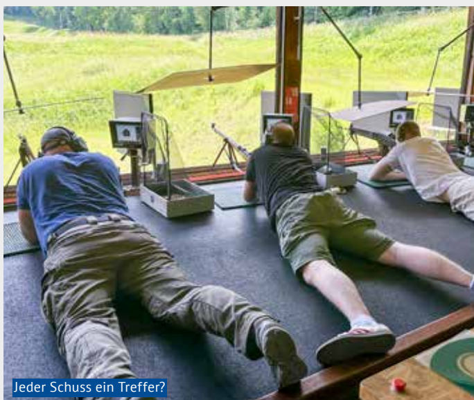
Jeder Schuss ein Treffer?