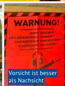
Vorsicht ist besser als Nachsicht

Schon beim Betreten der Schiessanlage gehört der Gehörschutz zur Grundausstattung. Auf den Distanzen von 50 Metern mit der Pistole und 300 Metern mit dem Gewehr fallen im Minutentakt Schüsse. Das dumpfe Knallen prägt die Geräuschkulisse, dennoch wirkt die Atmosphäre ruhig und geordnet. Die Schützinnen und Schützen bewegen sich routiniert zwischen Anmeldung, Waffenkontrolle und Schützenstand. Kommandos werden klar und besonnen gegeben, jeder Handgriff sitzt.