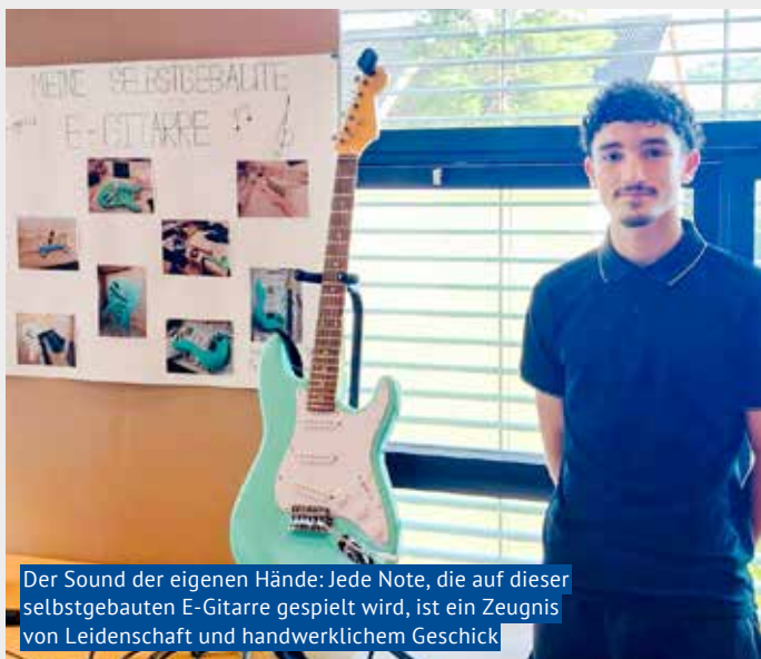
Der Sound der eigenen Hände: Jede Note, die auf dieser selbstgebauten E-Gitarre gespielt wird, ist ein Zeugnis von Leidenschaft und handwerklichem Geschick