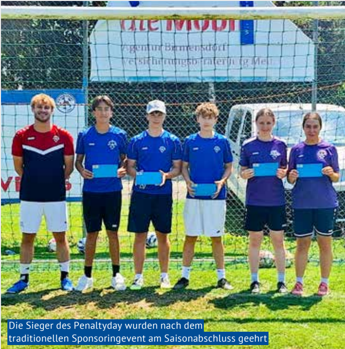
Die Sieger des Penaltyday wurden nach dem traditionellen Sponsoringevent am Saisonabschluss geehrt