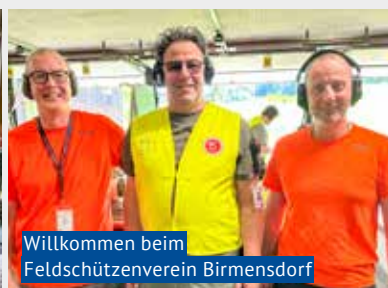
Willkommen beim Feldschützenverein Birmensdorf