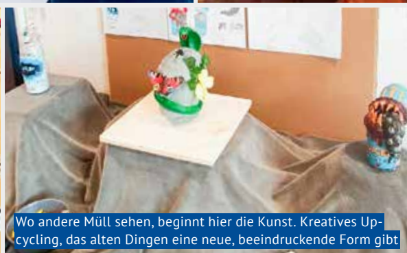
Wo andere Müll sehen, beginnt hier die Kunst. Kreatives Up-cycling, das alten Dingen eine neue, beeindruckende Form gibt