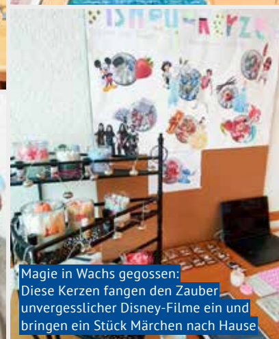
Magie in Wachs gegossen: Diese Kerzen fangen den Zauber unvergesslicher Disney-Filme ein und bringen ein Stück Märchen nach Hause

Einmal mehr bewiesen die Schülerinnen und Schüler der 3. Sekundarklassen bei der diesjährigen Vernissage ihrer Abschlussprojekte grosses Engagement und Ideenreichtum. Die Vielfalt und Qualität der Arbeiten beeindruckten zahlreiche Besucherinnen und Besucher.