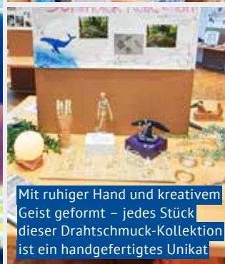
Mit ruhiger Hand und kreativem Geist geformt – jedes Stück dieser Drahtschmuck-Kollektion ist ein handgefertigtes Unikat