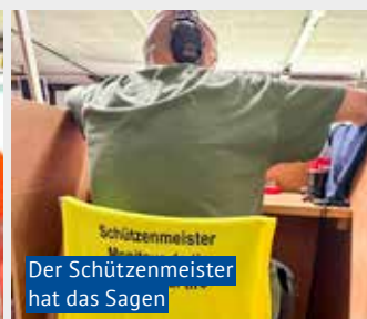
Der Schützenmeister hat das Sagen