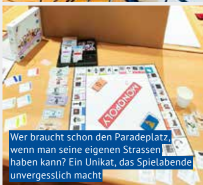
Wer braucht schon den Paradeplatz, wenn man seine eigenen Strassen haben kann? Ein Unikat, das Spielabende unvergesslich macht