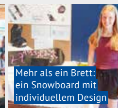
Mehr als ein Brett: ein Snowboard mit individuellem Design